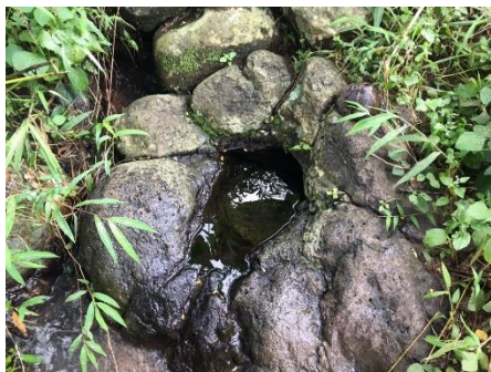
Tuk Lumpang di Desa Sendang

Toponimi berdasarkan aspek kemasyarakatan berkaitan dengan (a) interaksi sosial atau tempat berinteraksi sosial, (b) ekonomi, (c) tradisi, (d) adat istiadat, (f) pekerjaan, (g) kedudukan seseorang dalam masyarakat, dan (h) tokoh masyarakat.