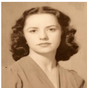
Gambar Virginia Henderson