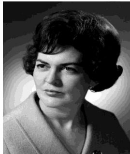
Gambar Jean Watson

Filosofi dan Sains Caring Jean Watson (2008), sebuah publikasi baru-baru ini, dibangun di atas karya sebelumnya, Keperawatan: Ilmu Manusia dan, Perawatan Manusia: Teori Keperawatan. Watson menyebut teorinya adalah deskriptif tentang caring dan menyatakan bahwa satu-satunya teori keperawatan yang menggabungkan dimensi spiritual keperawatan pada saat pertama kali dikonseptualisasikan. Watson selalu menggambarkan manusia sebagai makhluk holistik, interaktif, dan sekarang eksplisit dalam