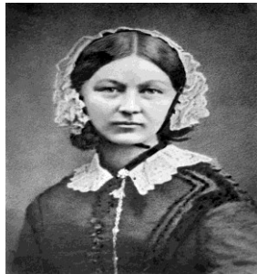
Gambar Florence Nightingale