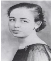
Gambar Martha Rogers

Martha Rogers lahir pada 12 Mei 1914 (peringatan kelahiran Florence Nightingale) di Dallas, Texas. Dia memperoleh diploma keperawatan dari Knoxville General Hospital pada tahun 1936 dan gelar sarjana dari George Peabody College di Nashville, Tennessee pada tahun 1937. Dia kemudian menerima gelar master dalam keperawatan kesehatan masyarakat dari Teachers College, Universitas Columbia di New York, dan gelar master dalam kesehatan masyarakat dan Doctor of Science dari The Johns Hopkins University di Baltimore, Maryland (Gunther dalam (McEwen & Wills, 2011)). Rogers menjadi kepala Divisi Keperawatan Universitas New York (NYU) pada tahun 1954, di mana ia berfokus pada pengajaran dan perumusan serta penjabaran teorinya (Hektor dalam (McEwen & Wills, 2011)). Rogers meninggal pada Maret 1994.