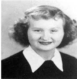
Gambar Imogene King