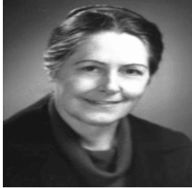
Gambar Betty Neuman

Betty Neuman lahir pada tahun 1924 di sebuah peternakan dekat Lowell, Ohio. Tahun 1947 memperoleh diploma keperawatan dari People's Hospital School of Nursing, Akron, Ohio. Dia memperoleh gelar sarjana keperawatan dari UCLA dan juga belajar psikologi dan kesehatan masyarakat. Tahun 1966 memperoleh gelar master di bidang kesehatan mental dan konsultasi kesehatan masyarakat, juga dari UCLA, kemudian meraih gelar doktor dalam psikologi klinis pada tahun 1985 dari Pacific Western University. Dia telah mengajar keperawatan medis-bedah, perawatan kritis, dan keperawatan penyakit menular di University of Southern California Medical Center di Los Angeles dan di perguruan tinggi lain di Ohio dan West Virginia (Neuman & Fawcett, 2002 dalam (McEwen & Wills, 2011))