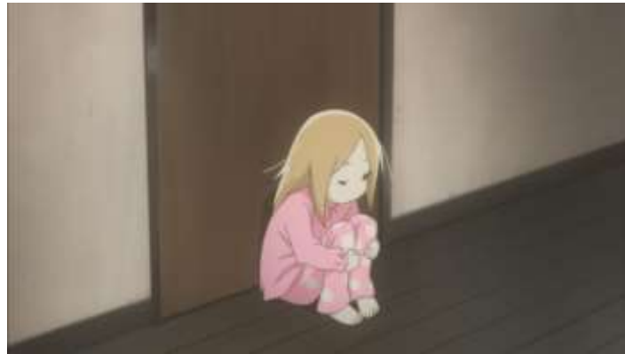
Gambar 33. Rin yang menunggu Daikichi di depan pintu kamar mandi (Episode 3 08.04)

dengan ketakutan akan ditinggalkan oleh orang yang ia sayangi. Hal tersebut dapat dilihat pada adegan berikut ini.