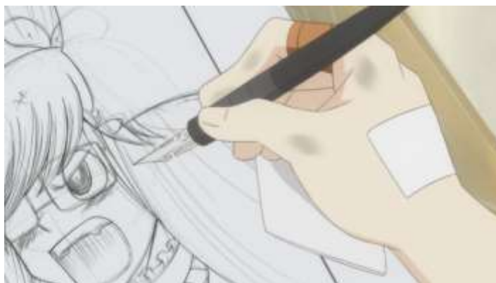
Gambar 9. Tangan Masako yang terluka karena bekerja keras (Episode 8 19.15-19.32)