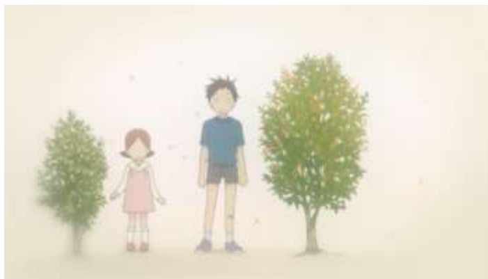
Gambar 28. Daikichi dengan pohon miliknya (Episode 6 04.57)

Akan tetapi, tidak ada yang mengetahui apakah Rin memiliki pohon sebagai peringatan kelahirannya atau tidak. Ketidaktahuan Daikichi mengenai pohon Rin adalah permasalahan pada episode ini.