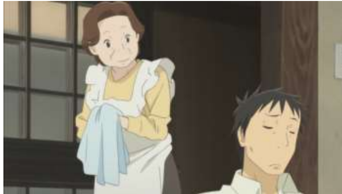
Gambar 21. Tokoh Kawachi Sachiko (Episode 1 08.12-08.16)