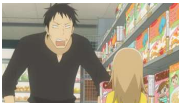
Gambar 55. Rin yang ingin membeli jajan (Episode 6 2.25-3.46)

Pada suatu hari ketika Daikichi dan Rin sedang berbelanja di supermarket. Tiba-tiba Rin hilang begitu saja dari pandangan Daikichi. Daikichi pun mencarinya ke penjuru supermarket.