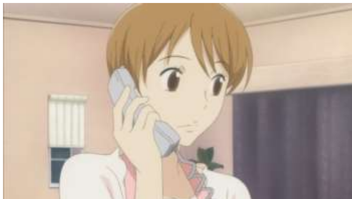
Gambar 38. Haruko ditelfon oleh Daikichi (Episode 2 04.51-05.00)

Usagi Drop. Tujuan Daikichi pada anime ini adalah untuk membahagiakan serta dapat merawat Rin dengan baik. Hal ini terlihat pada adegan Daikichi yang menelfon ke Haruko karena ia tak mengetahui cara menitipkan Rin ke penitipan anak.