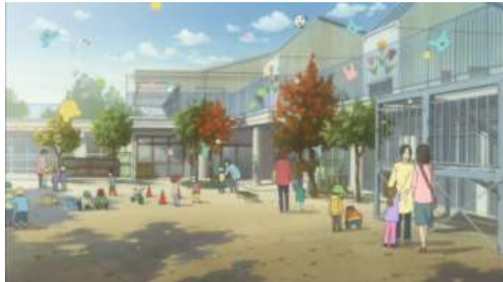
Gambar 47. Tempat Penitipan Anak (Episode 2 09.12)

yang cukup. Usia anak yang dititipkan disini pun bermacam-macam, mulai dari bayi hingga anak usia SD ditampung disini.