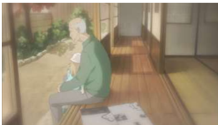
Gambar 51. Adegan kilas balik ketika Souichi masih hidup (Episode 4 16.35)

Pada anime Usagi Drop terdapat adegan kilas balik yang memperlihatkan cerita ketika Souichi masih hidup dan cerita ketika Sachiko sedang merawat Daikichi yang masih bayi. Akan tetapi, anime ini tidak memiliki adegan yang mempengaruhi frekuensi waktunya.