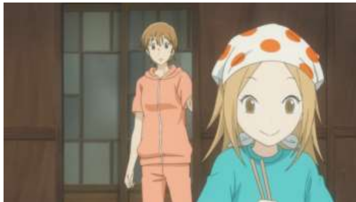
Gambar 43. Rin yang sedang menyiapkan sarapan (Episode 7 10.40-10.51)

Dari dialog pada kalimat 「あのね、私をのほうちようほしい」 yang berarti “Anu, aku mau pisau masak sendiri” Rin meminta Daikichi untuk membelikannya pisau yang dapat digunakan untuk anak-anak memasak. Rin kemudian terus belajar memasak setiap harinya. Hingga pada episode 7, Rin diperlihatkan bangun lebih pagi dari yang lain dan sedang menyiapkan sarapan untuk Daikichi beserta Haruko dan Reina yang sedang menginap di rumahnya. Hal tersebut dapat dilihat pada cuplikan adegan berikut.