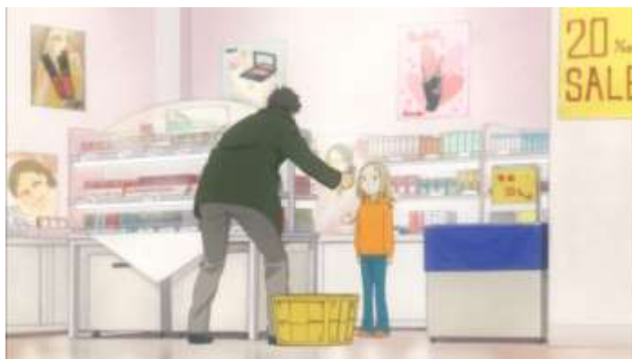
Gambar 52. Rin yang menginginkan lipstik untuk dirinya (Episode 4 22.19-22.50)

Pada saat Rin dan Daikichi berbelanja di mall, ketika Daikichi sedang memilihkan cangkir untuk Rin, Rin menghilang dari sisi Daikichi. Daikichi lantas langsung berteriak dan mencari Rin ke penjuru mall. Daikichi yang berteriak mencari Rin lantas menjadi pusat perhatian orang-orang di mall. Hingga pada akhirnya ketika Daikichi sedang berada di bagian kosmetik, Rin memanggil Daikichi dari balik etalase.