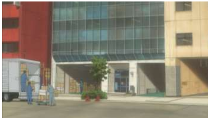
Gambar 46. Kantor Daikichi (Episode 2 11.23)

Kantor Daikichi merupakan sebuah perusahaan yang bergerak dalam bidang produksi pakaian. Kantor ini sering muncul ketika adegan yang memperlihatkan Daikichi yang sedang bekerja.