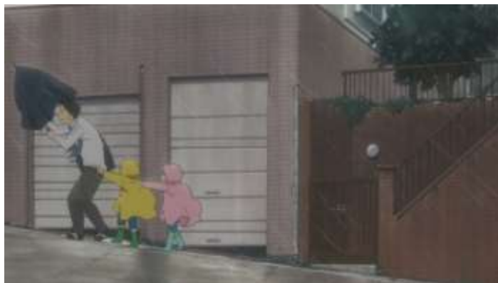
Gambar 31. Daikichi, Rin dan Kouki yang menerjang Badai (Episode 9 12.49)

Permasalahan yang terdapat pada Episode 9 adalah badai yang datang menghadang di wilayah kediaman Daikichi dan Rin. Ramalan cuaca terkait badai yang akan datang telah disiarkan melalui televisi. Tanda-tanda cuaca juga sudah terlihat pada saat adegan Kouki bermain lempar topi ke arah yang berlawanan dengan arah angin. Akhirnya, tiba saat waktu Rin pulang dan dijemput oleh Daikichi dari tempat penitipan anak. Semua anak telah dijemput oleh orang tua mereka kecuali Kouki. Daikichi dan Rin memutuskan untuk mengajak Kouki pulang mampir terlebih dahulu ke rumah mereka yang menjadi permasalahan pada episode ini.