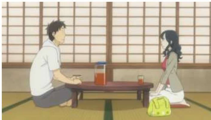
Gambar 15. Yukari yang meneduh di rumah Daikichi (Episode 9 14.28-14.42)