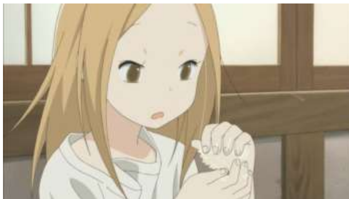
Gambar 41. Rin sedang mengepal onigiri (Episode 1 22.58)

Kemudian pada episode 5, Rin mulai tertarik untuk meringankan beban Daikichi dengan cara memasak.