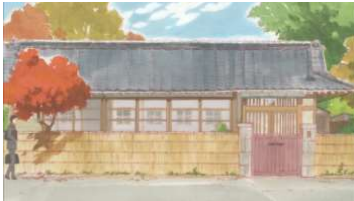
Gambar 45. Rumah Kakek (Episode 01.30)