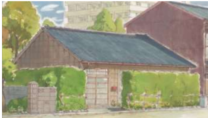
Gambar 44. Rumah Daikichi (Episode 1 00.46)

Rumah Daikichi merupakan tempat yang paling sering muncul pada anime ini. Pada awal cerita anime ini, rumah ini hanya dihuni oleh Daikichi seorang. Akan tetapi setelah bertemu dengan Rin, mereka berdua tinggal di rumah ini. Rumah Daikichi dapat dilihat pada awal episode satu di menit 00.46 berikut ini.