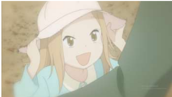
Gambar 4. Tokoh Kaga Rin (Episode 4 15.50-16.15)

sebagai pembantu ayahnya dan pergi untuk mengejar mimpinya. Setelah kematian ayahnya, Rin kemudian diasuh oleh Daikichi yang merupakan cucu dari ayah Rin.