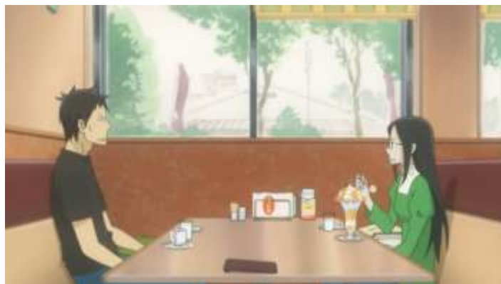
Gambar 35. Daikichi bertemu dengan Masako kedua kalinya (Episode 6 14.42-14.52)

Pada episode 6, permasalahan yang digambarkan adalah mengenai Daikichi yang tidak mengetahui apakah Rin memiliki pohon sebagai peringatan kelahirannya atau tidak. Permasalahan ini memunculkan konflik di mana Daikichi akhirnya berusaha mencari tentang pohon milik Rin. Konflik dimulai ketika Daikichi menawarkan Rin untuk menanam pohon sebagai tanda peringatan Rin masuk SD. Kemudian ia juga menceritakan pohon yang ditanam di halaman rumah orang tuanya. Pohon tersebut merupakan pohon yang ditanam bersamaan dengan Daikichi lahir. Pohon itu ditanam sebagai peringatan seseorang akan terus tumbuh seiring dengan usia seseorang. Akan tetapi Rin bertanya kepada Daikichi apakah ia juga memiliki pohon yang ditanam untuk memperingati kelahirannya. Sayangnya Daikichi tidak mengetahui tentang pohon Rin. Akhirnya Daikichi terpaksa harus menemui Masako lagi demi mencari tahu keberadaan pohon Rin.