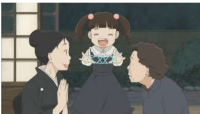
Gambar 18. Reina memamerkan ayatori Rin (Episode 1 09.41)

Pada saat hari sebelum pemakaman Souichi semua keluarga besar berkumpul di ruang duka. Pada saat itu dengan lihai Rin sedang bermain tali. Reina