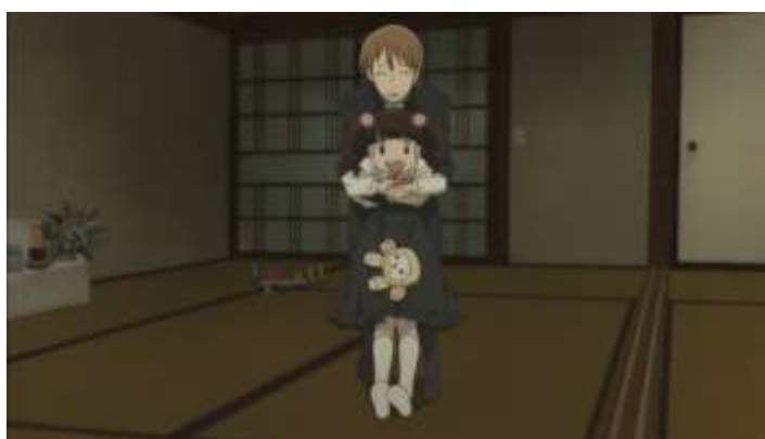
Gambar 19. Adegan Haruko Menggendong Reina yang Mengganggu Daikichi (Episode 1 16.49-16.59)