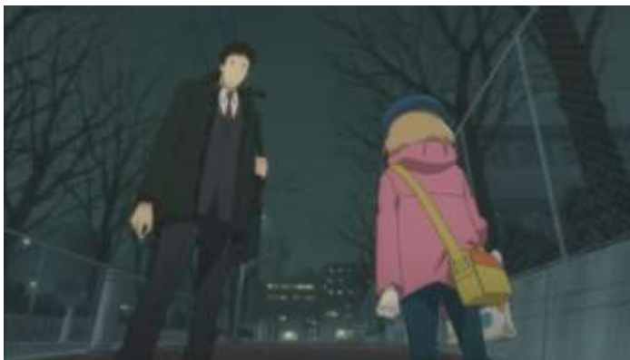
Gambar 26. Rin yang mempertanyakan keberadaan ibunya (Episode 4 05.13-05..33)

Permasalahan yang ada pada episode 4 adalah kurangnya informasi mengenai ibu kandung Rin.