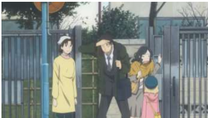
Gambar 14. Yukari yang Tergesa-gesa Terlambat Datang untuk Menjemput Kouki (Episode 4 11.02-11.08)

Hidup menjadi seorang single parent membuat Yukari menjadi sangat menyayangi anaknya. Salah satu bentuk rasa sayang tersebut dapat dibuktikan dalam salah satu adegan berikut.