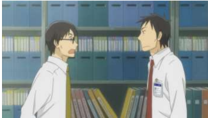
Gambar 39. Daikichi yang Meminta Dipindahkan ke Bagian Kerja Lain (Episode 3 18.49-19.02)

ダイキチ : あの、いきなりなんですが、残業のないかい どうさせていただきます ヒラカ : え?! なに?! かわち、本気で言うの? ダイキチ : メチャクチャ本気です