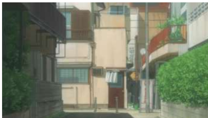
Gambar 49. Perumahan di Jepang (Episode 6 12:17)

Perumahan di Jepang merupakan tempat yang hampir selalu muncul pada setiap episode di anime Usagi Drop. Biasanya tempat ini akan muncul ketika adegan-adegan Rin yang berangkat sekolah maupun ketika ia pulang bersama Daikichi dari tempat penitipan anak. Tempat ini biasanya digambarkan dengan sebuah jalan kecil yang di pinggirnya terdapat rumah-rumah.