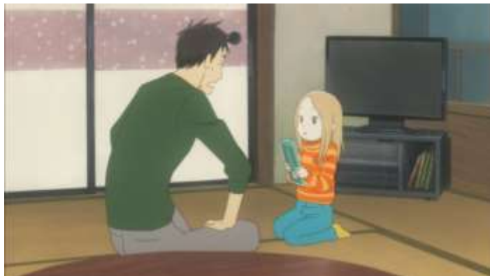
Gambar 54. Daikichi membelikan Rin Pisau (Episode 5 14.04-14.20)

membelikan pisau untuk Rin memasak. Meskipun begitu pada sore harinya Daikichi justru membelikan Rin pisau yang ia inginkan.