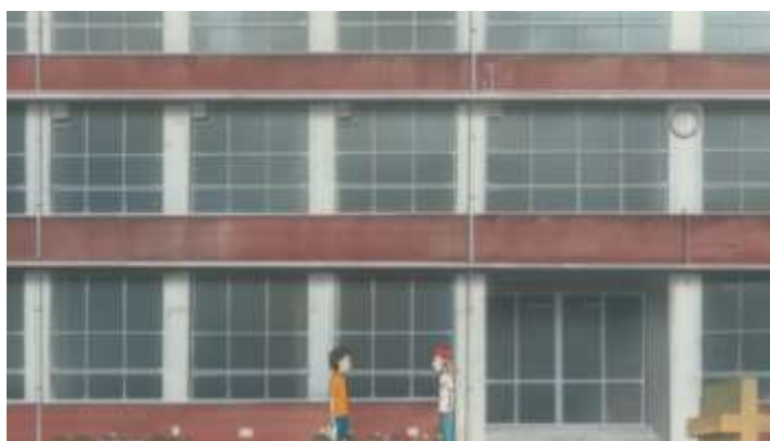
Gambar 50. Sekolah Dasar Rin dan Kouki (Episode 9 08.59)

Sekolah merupakan tempat anak-anak usia sekolah untuk belajar. Sekolah ini merupakan sekolah dasar dimana Rin dan Kouki belajar. Biasanya tempat ini muncul ketika menceritakan kisah Rin dan Kouki yang belajar di sekolah. Tak hanya itu ketika pendaftaran dan penerimaan siswa baru, tempat ini juga muncul.