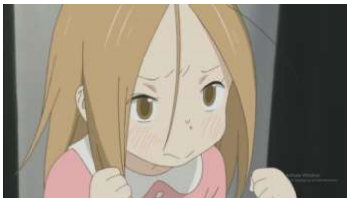
Gambar 5. Adegan Rin yang Menahan Kantuk Untuk Menjaga Dupa Sang Ayah Tetap Hidup (Episode 1 10.29-11.41)

Rin digambarkan sebagai anak yang kuat dan tegar. Hal tersebut dapat dibuktikan pada sebagian besar adegan pada episode 1. Salah satunya pada adegan berikut.