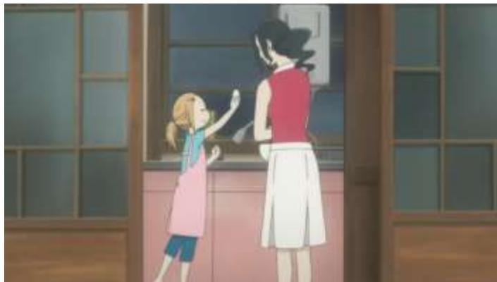
Gambar 6. Rin mengupas telur (Episode 9 16.12-16.28)