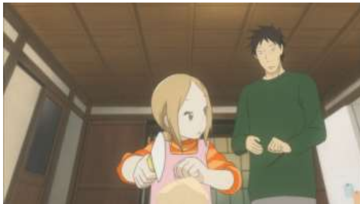
Gambar 40. Rin yang belajar memotong kentang (Episode 5 14.35-14.51)

リン：あれ、押すんだけ？、引くんだけ？ ダイキチ：あれ？貸してみ。ああ、こう こう リン：わ～ダイキチ上手だね