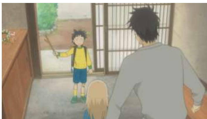
Gambar 10. Tokoh Nitani Kouki (Episode 6 10.00-10.03)

Kouki adalah seorang anak laki-laki berusia 6 tahun yang merupakan teman Rin di sekolah. Kouki digambarkan sebagai seorang anak laki-laki berambut hitam yang nakal. Dalam cerita ia digambarkan sebagai seseorang yang secara diam-diam memendam perasaan kepada Rin.