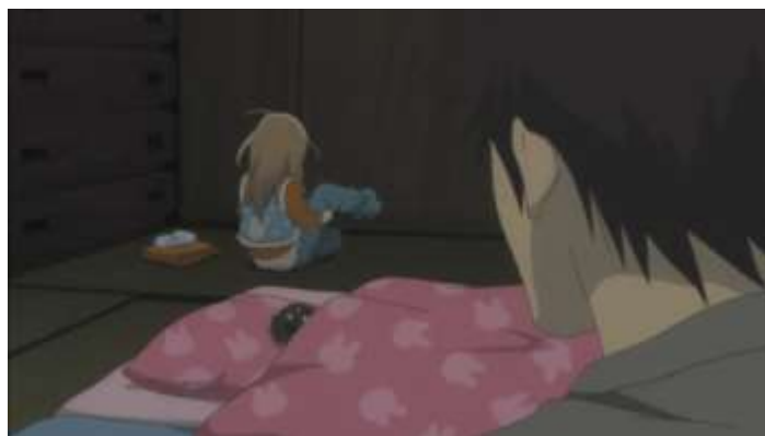
Gambar 25. Daikichi memergoki Rin yang mengganti pakaian karena mengompol (Episode 3 17.03)

Permasalahan yang terdapat pada episode 3 adalah mengenai Rin yang mengompol setiap malam. Daikichi beranggapan bahwa kejadian tersebut adalah sesuatu yang wajar bagi anak seusia Rin. Akan tetapi, setelah berbincang dengan Gotou seorang ibu satu anak yang merupakan teman kerja Daikichi, ia menyimpulkan bahwa bisa jadi alasan Rin mengompol disebabkan oleh rasa takut Rin akan kehilangan seseorang yang ia sayangi lagi setelah kematian ayahnya. Hal ini terbukti ketika secara tidak sengaja Daikichi memergoki Rin yang bangun tengah malam untuk mengganti pakaiannya karena mengompol. Daikichi menawarkan Rin untuk membangunkannya ketika mengompol lagi ataupun ketika Rin hendak ke toilet. Akan tetapi Rin menolaknya. Pada saat itu, Rin pun mengutarakan kegelisahannya karena takut apabila Daikichi akan meninggal sebelum dirinya. Kondisi Rin yang mengompol setiap malam karena takut ditinggal oleh orang yang disayangi menjadi permasalahan bagi Daikichi untuk merawat Rin dengan baik.