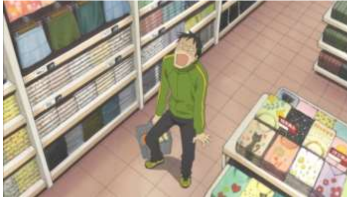
Gambar 24. Adegan Daikichi yang Baru Menyadari Besok Adalah Hari Senin (Episode 2 03.25-03.50)

Permasalahan yang ada pada episode 2 adalah Daikichi harus pergi bekerja sedangkan ia harus menjaga Rin yang masih belum masuk sekolah.