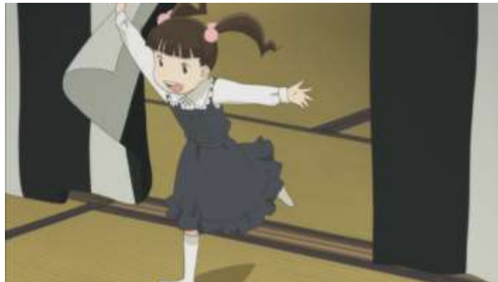
Gambar 16. Tokoh Maeda Reina (Episode 1 07.12-07.14)

Reina adalah seorang anak berusia 6 tahun yang merupakan anak dari sepupu Daikichi. Reina digambarkan sebagai seorang anak perempuan dengan rambut keping dua kecoklatan.