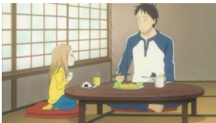
Gambar 42. Rin yang meminta untuk dibelikan pisau anak-anak kepada Daikichi (Episode 5 02.52-3.11)

Kemudian pada episode 5, Rin mulai tertarik untuk meringankan beban Daikichi dengan cara memasak.