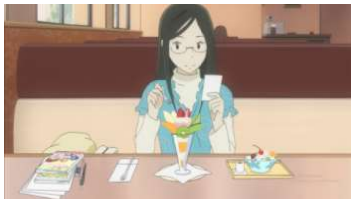
Gambar 7. Tokoh Yoshii Masako (Episode 5 07.24-07.26)

Masako adalah seorang wanita muda yang tak lain adalah ibu kandung dari Rin. Masako digambarkan sebagai seorang wanita berkacamata dengan rambut hitam lurus yang indah. Ia bekerja sebagai mangaka yang dikenal dengan nama pena Saionji.