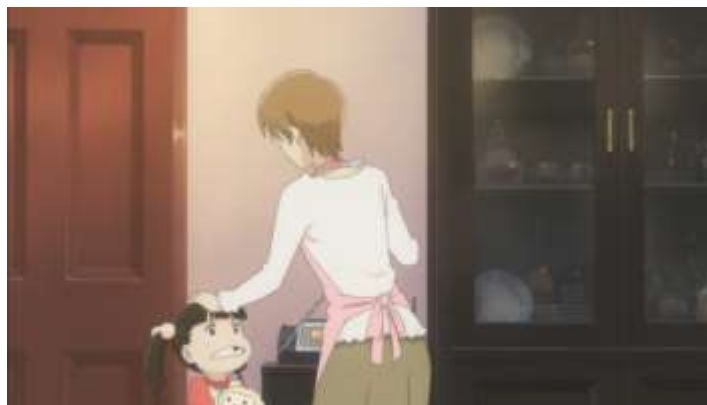
Gambar 17. Reina yang ingin berbicara dengan Rin (Episode 2 05.34-05.56)

レイナ：ママ、それリンちゃん？リンちゃん！リンちゃん！ ハルコ：ちょっとレイナ、今大事な話だから レイナ：リンちゃん！リンちゃん！ ハルコ：緊急いちじゅう保育があって ダイキチ：緊急いちじゅう保育？わ～ レイナ：リンちゃん！ ハルコ：何、ダイちゃん ダイキチ：ああ、こちのこと