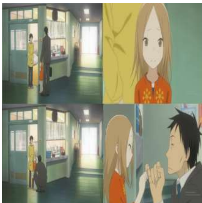
Gambar 56. Rin yang dititipkan di tempat penitipan anak (Episode 2 09.25-10.25)

Pada hari Senin pertama Daikichi dan Rin tinggal bersama, Rin masih belum masuk sekolah sedangkan Daikichi harus pergi bekerja. Akhirnya Daikichi memutuskan untuk menitipkan Rin di tempat penitipan anak. Akan tetapi ketika Daikichi baru saja menitipkan Rin di tempat penitipan anak, belum sampai di depan pintu keluar Daikichi menoleh ke arah Rin dan melihat wajahnya yang sangat sedih.