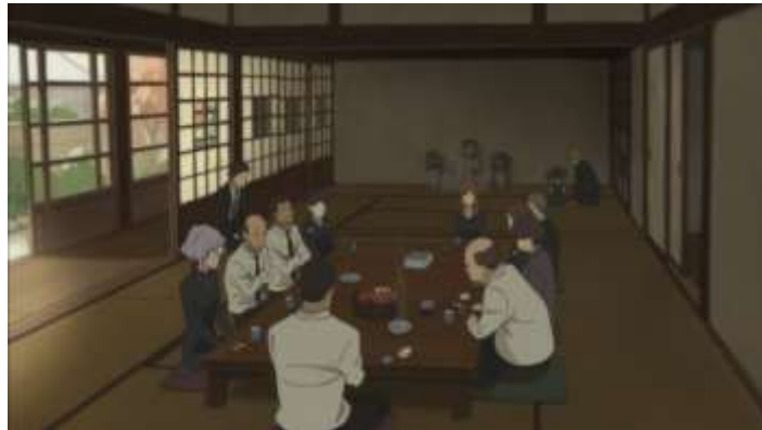
Gambar 32. Suasana ketika sedang membicarakan hak asuh Rin (Episode 1 16.15)

menjaga toko, dan lain sebagainya. Bahkan mereka juga mulai meragukan apakah Rin benar-benar anak dari Souichi yang tak lain adalah kakek Daikichi. Akhirnya mereka saling melemparkan tanggung jawab untuk mengasuh Rin hingga Daikichi menawarkan dirinya sebagai seseorang yang akan mengasuh Rin.