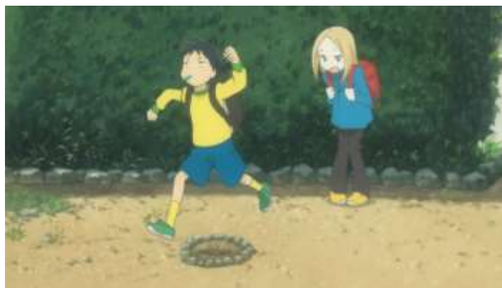
Gambar 11. Adegan Kouki meniup-niup peluit (Episode 6 10.43-11.15)

Cuplikan adegan diatas menceritakan tentang Kouki yang tiba-tiba datang mengunjungi Rin dengan membawa ranting pohon yang ia ambil dari pohon tetangga. Kouki berencana untuk mengajak Rin berangkat sekolah bersama. Akan tetapi, Kouki pergi ke rumah Rin tanpa berpamitan ke Ibunya yang membuat ibunya khawatir dan menelfon Daikichi. Ia juga menuju rumah Rin dengan cara menerobos kebun yang menyebabkan pakaiannya menjadi kotor. Tidak hanya itu, sifat nakal Kouki juga ditunjukkan pada adegan berikut.