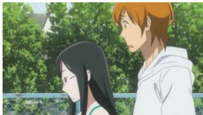
Gambar 8. Masako yang berambisi (Episode 8 16.08-16.44)