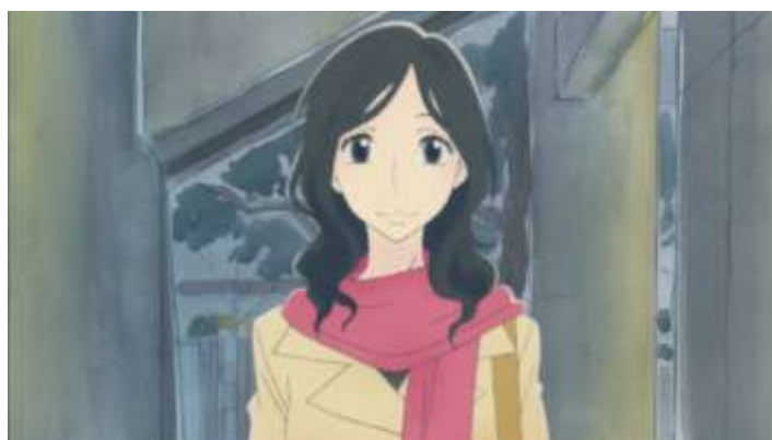
Gambar 13. Tokoh Nitani Yukari (Episode 4 02.04 – 02.09)

Yukari adalah seorang wanita janda beranak satu yang tak lain adalah ibu dari Kouki. Yukari digambarkan sebagai seorang wanita kantoran dengan mata hitam besar dan rambut hitam berombak.