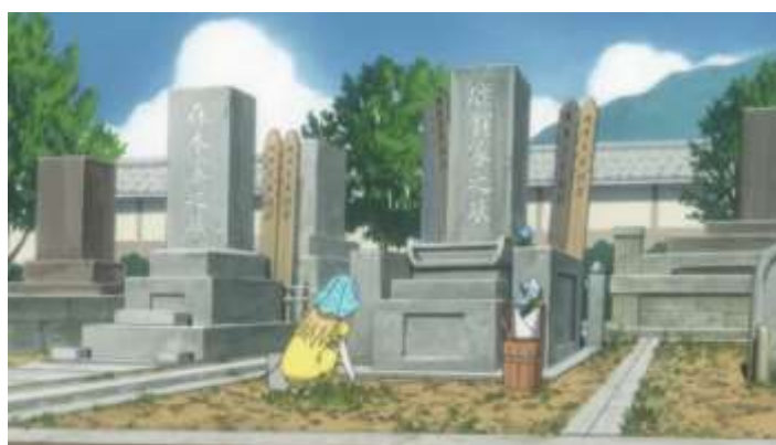
Gambar 48. Makam Kakek (Episode 8 11.59)

Makam Kakek adalah tempat Kakek Daikichi atau Kaga Souichi dimakamkan. Tempat ini merupakan tempat peristirahatan terakhir bagi seseorang yang telah meninggal. Berbeda dengan makam yang terdapat di Indonesia, orang yang dimakamkan di makam yang ada di Jepang akan dikremasi terlebih dahulu yang kemudian abu dari tubuhnya akan di taruh pada batu nisan yang ada di pemakaman.