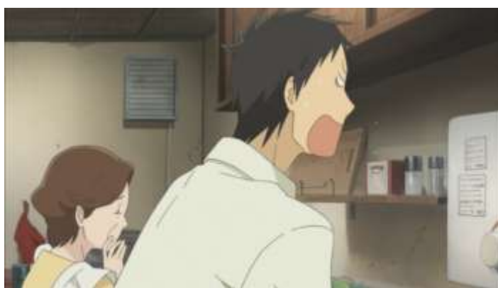
Gambar 23. Adegan Daikichi Diberitahu Ibunya Kalau Kakeknya Punya Anak Lagi (Episode 1 04.52-05.07)

Permasalahan yang terdapat pada episode 1 adalah kematian kakek Daikichi yaitu Souichi yang tanpa disangka meninggalkan seorang anak gadis yang tidak diketahui asal muasal keluarganya. Hal tersebut dapat dilihat pada adegan berikut.