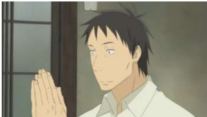
Gambar 1. Tokoh Daikichi (Episode 1 06.09)