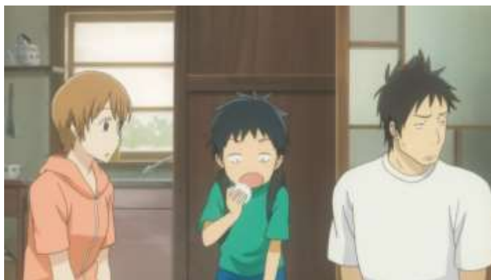
Gambar 3. Daikichi memberikan onigirinya kepada Kouki (Episode 2 12.21-12.32)

コウキ：ダイキチおにぎり食うていい ダイキチ：飯食うてきたんだろう コウキ：食うた ダイキチ：いいよ、食うはよ。これ、おれんだけどな コウキ：やった！