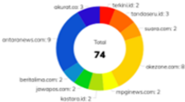
Gambar 1. Jumlah Berita Per Media

menjadi cenderung kurang selektif. Masyarakat harus kritis dan bisa kreatif memanfaatkan aplikasi web yang tersedia untuk mengecek COVID-19, misalnya cekfakta.com , www.covid19.go.id/hoax-buster , Tirto.id , liputan6.com .