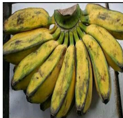
Gambar 6. Pisang Kepok yang merupakan jenis pisang paling sering dibeli konsumen