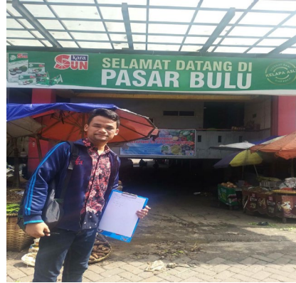
Gambar 2. Pasar Bulu