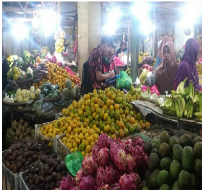
Gambar 3. Wawancara Responden