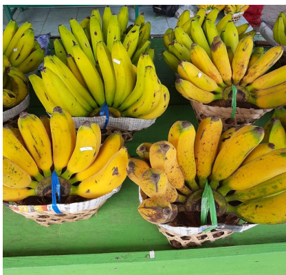
Gambar 5. Pisang dengan atributnya yang berbeda-beda