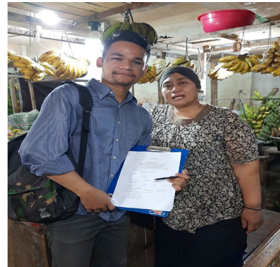
Gambar 4. Responden Buah Pisang