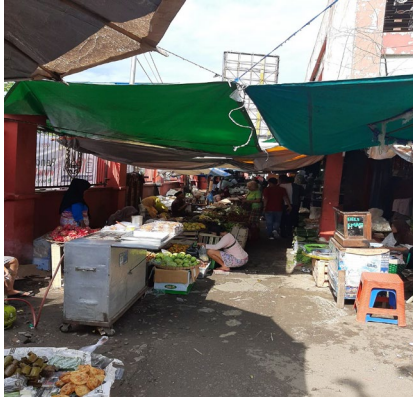
Gambar 1. Keadaan Pasar Karangayu