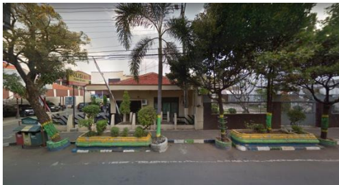
Gambar 5.3 Kondisi sekitar