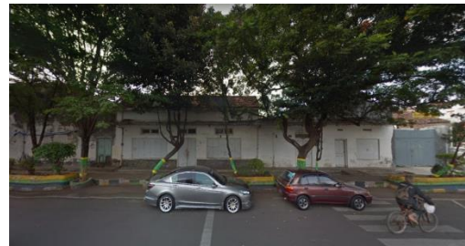
Gambar 5.4 Kondisi eksisting