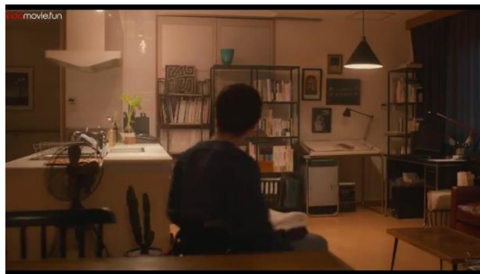
Gambar 26. Apartemen Ayukawa ( Paafekuto Waarudo , 2018. 00.45.42)

Adegan di atas menampilkan setting ruang tempat tinggal Ayukawa, yaitu sebuah apartemen. Ayukawa memilih untuk tinggal seorang diri di kota Tokyo, jauh dari kampung halamannya tempat di mana orang tuanya tinggal. Setelah lulus kuliah Ayukawa memutuskan untuk hidup mandiri meskipun dengan keterbatasan fisik yang dimilikinya. Namun, hal ini justru membuat orang tuanya sangat khawatir mengingat kondisi anaknya yang sangat membutuhkan bantuan orang lain.