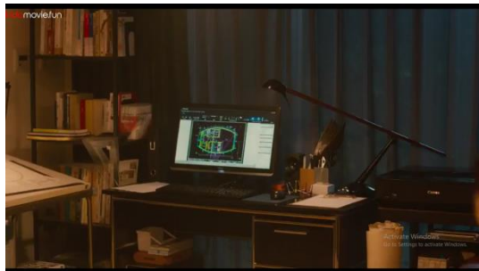
Gambar 14. Meja kerja Ayukawa di rumahnya. ( Paafekuto Waarudo , 2018. 00.59.14)