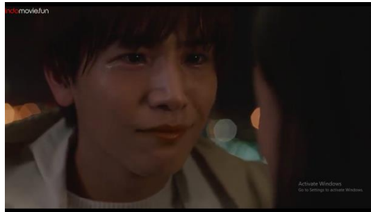
Gambar 24. Ayukawa menangis karena memutuskan untuk mengakhiri hubungannya dengan Kawana. ( Paafekuto Waarudo , 2018. 01.16.18)