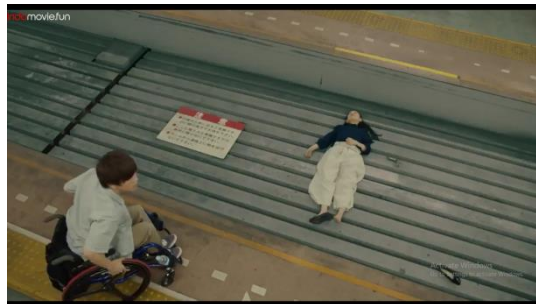
Gambar 11. Kawana terjatuh di platform rel kereta api. ( Paafekuto Waarudo , 2018. 01.03.12)

Terjatuhnya Kawana di platform rel kereta api, merupakan permasalahan awal dalam film ini. Hal ini memicu munculnya konflik dalam diri Ayukawa, karena tidak bisa menjaga dan menolong kawana dengan kondisinya. Atas peristiwa tersebut Ayukawa mulai merasa tidak percaya diri dan menyalahkan dirinya sendiri, karena disabilitas yang dialaminya tidak bisa menolong dan menjaga wanita yang dicintainya.