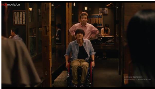
Gambar 21. Ayukawa sedang makan malam tim perusahaan bersama tim dari perusahaan Kawana. ( Paafekuto Waarudo , 2018. 00.07.15)

mengalami kerusakan pada fungsi gerakanya akibat kecelakaan, sehingga memiliki status baru sebagai penyandang disabilitas. Namun dilihat dari bentuk tubuhnya, Ayukawa tumbuh sebagai laki-laki dewasa pada umumnya yang mengalami pertumbuhan tulang dan otot.