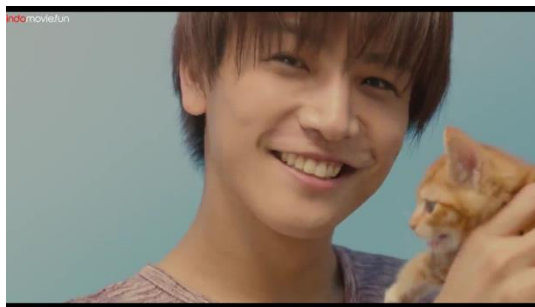
Gambar 9. Itsuki Ayukawa. ( Paafekuto Waarudo , 2018. 00.36.21)

merupakan seorang laki-laki penyandang disabilitas yang berprofesi sebagai desain arsitektur disalah satu perusahaan di kota Tokyo. Menjadi penyandang disabilitas tidak menghalangi Ayukawa dalam meraih mimpinya untuk menjadi seorang desain arsitektur, karena hal inilah Ayukawa mampu menarik simpati penonton. Dalam film ini Ayukawa menampilkan sosok laki-laki difabel yang pantang menyerah, bertanggung jawab, cerdas, mandiri dan baik hati.