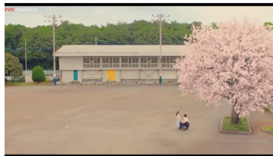
Gambar 18. Ayukawa melamar Kawana di bawah pohon bunga sakura ( Paafekuto waarudo , 2018. 01.37.48)