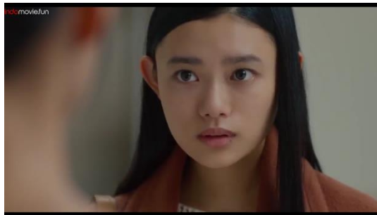
Gambar 8. Tsugumi Kawana. ( Paafekuto Waarudo .2018, 01.28.21)

Tsugumi Kawana merupakan seorang karyawan desain interior di perusahaan yang bernama Cranberry di kota Tokyo. Kawana mampu menarik simpati penonton, karena ketulusan cintanya kepada Ayukawa tanpa memandang perbedaan fisik. Kelumpuhan yang dialami oleh Ayukawa tidak membuat Kawana berpaling dari cinta pertamanya, bahkan Kawana selalu memberi dukungan dan menerima apa adanya kondisi yang dialami oleh Ayukawa. Selain memiliki sifat yang tulus, Kawana memiliki sifat baik lainnya yaitu peduli terhadap orang lain. Namun, dibalik sifat baiknya tersebut, Kawana merupakan sosok wanita yang kurang memiliki kepercayaan diri terhadap kemampuannya.