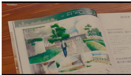
Gambar 5. Portofolio lomba desain distrik Sakuragaoka. ( Paafekuto Waarudo , 2018. 00.21.00)

Durasi waktu pada film PW selama 1 jam 42 menit 39 detik. Film ini mengambil latar waktu pada tahun 2018, bisa dikatakan film ini termasuk dalam era Heisei (8 Januari 1989 – 30 April 2019). Hal ini dapat dibuktikan pada portofolio yang ditunjukkan oleh seorang klien kepada Ayukawa.