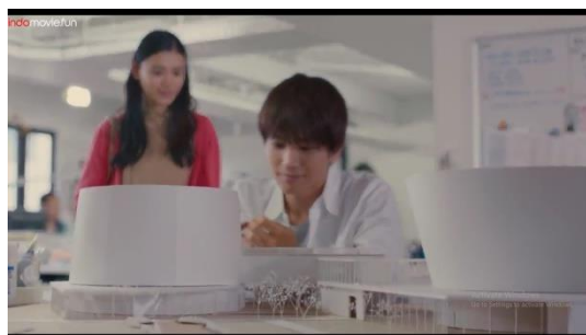
Gambar 27. Ayukawa sedang membuat maket bangunan. ( Paafekuto Waarudo , 2018. 00.08.56)