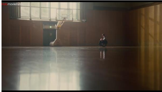
Gambar 2. Aula olahraga khusus penyandang disabilitas ( Paafekuto Waarudo , 2018. 01.10.42)