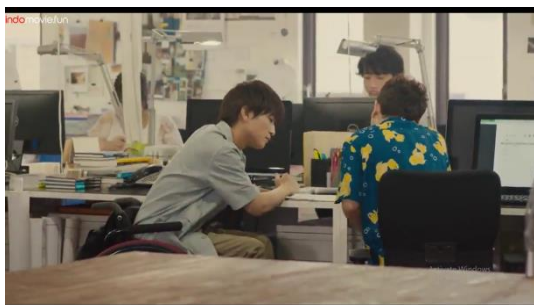
Gambar 4. Meja kerja Ayukawa di tempat kerja. ( Paafekuto Waarudo , 2018. 01.01.48)