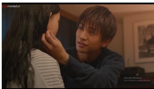
Gambar 23. Ayukawa membelai rambut dan bertatap mata dengan Kawana ( Paafekuto Waarudo , 2018. 00.47.43)

Seksualitas merupakan konsep yang diartikan sebagai pengalaman yang dimiliki laki-laki dekat dengan seorang perempuan atau laki-laki yang pernah atau sedang menjalin hubungan dengan lawan jenisnya.