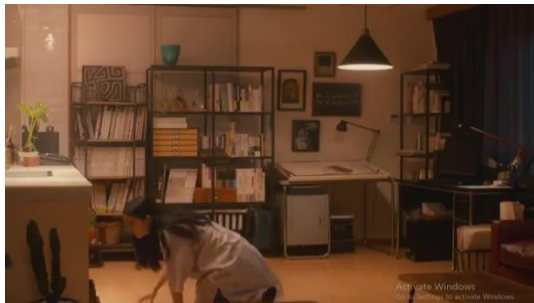
Gambar 3. Meja kerja Ayukawa di apartemen. ( Paafekuto Waarudo , 2018. 00.45.39)

Ruang kerja merupakan tempat di mana Ayukawa melakukan berbagai aktivitas salah satunya membuat desain bangunan. Di dalam film ini menampilkan dua ruang kerja yang berbeda yaitu, pertama ruang kerja di rumahnya sendiri, kemudian yang kedua ruang kerja di kantornya.