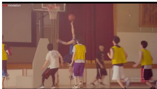
Gambar 12. Ayukawa sedang bermain bola basket bersama teman-temannya di aula olahraga sekolah (Paafekuto Waarudo, 2018. 01.14.13)

Gimnasium merupakan tempat Ayukawa dan teman-temannya melakukan aktivitas olahraga, salah satunya bermain bola basket. Aula olahraga tersebut memiliki beberapa ring basket, dan voli, terdapat pula satu panggung di sisi aula olahraga. Panggung ini digunakan ketika sekolah menyelenggarakan upacara kelulusan. Dalam film ini menampilkan dua aula olahraga berbeda yang terletak pada fasilitas yang digunakan .