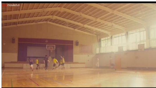
Gambar 6. Ayukawa bermain bola basket. ( Paafekuto Waarudo 2018, 00.00.58 dan 01.29.27)

menit ke 00.00.58 dan 01.29.27. Adegan ketika Ayukawa bermain bola basket terdapat pada menit ke 00.00.58, pada menit ini dilanjutkan dengan cerita dari sudut pandang Kawana. Adegan ini pula terulang kembali pada jam dan menit ke 01.29.27 melalui sudut pandang Ayukawa. Pada pengulangan ini terdapat perbedaan di mana pada adegan dengan sudut pandang Kawana menunjukkan kekagumannya kepada Ayukawa ketika bermain bola basket, sementara pada sudut pandang Ayukawa menunjukkan masa lalunya bermain bola basket dengan kondisi kedua kakinya masih bisa berjalan. Ayukawa mengingat potongan masa lalunya tersebut, saat menulis surat untuk Kawana sehari sebelum Ayukawa melakukan operasi pada sumsum tulang belakangnya agar bisa berjalan normal kembali.