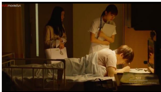
Gambar 10. Ayukawa memaksakan dirinya menggambar untuk kompetisi Sakuragaoka meskipun harus menggambar dengan posisi telungkup (Paafekuto Waarudo, 2018. 00.14.19)

Ayukawa sangat bersungguh-sungguh dengan profesinya sebagai seorang desain arsitektur. Bahkan Ayukawa mengikuti kompetisi desain arsitektur distrik Sakuragaoka. Namun, ketika waktu kompetisi hampir habis Ayukawa mengalami cedera pada sumsum tulang belakangnya, sehingga harus dilarikan ke rumah sakit. Dikarenakan waktu pengumpulan perspektif desain hanya tinggal menghitung jam, Ayukawa memaksakan diri menggambar dan melakukan pewarnaan meskipun harus dengan keadaan telungkup. Hal ini Ayukawa lakukan karena tidak ingin mengecewakan kepercayaan yang diberikan oleh perusahaan kepada dirinya dalam kompetisi ini.