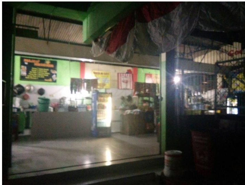
Gambar 3.2. Kantin Bawah SMA E Jakarta