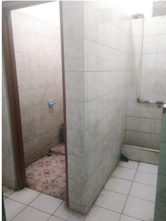
Gambar 3.3. Toilet Bawah SMA E Jakarta

Hampir seluruh warga sekolah mengetahui adanya konvensi tersebut. Mulai dari satpam, penjual makanan di kantin, bahkan guru pun cukup banyak yang mengetahuinya, seperti saat peneliti menanyakan letak kantin di sekolah ini. Kemudian Pak Satpam memberitahu kalau kantin di sekolah ini ada dua, kantin atas dan kantin bawah. Kantin atas hanya untuk kelas XII dan XI, tidak untuk kelas X. Siswa kelas XII bebas mau ke kantin manapun. Sedangkan siswa kelas X hanya diperbolehkan menggunakan kantin bawah.