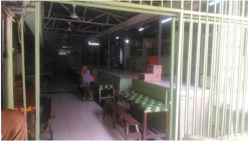
Gambar 3.1. Kantin Atas SMA E Jakarta