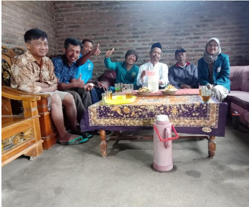
Kelompok Tani Argosariningtani