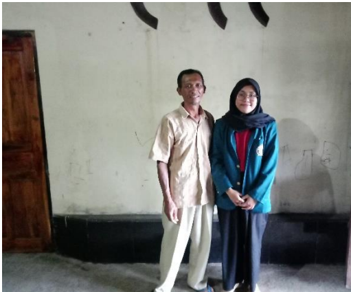
Kelompok Tani Sarana Tani