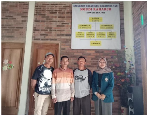
Kelompok Tani Ngudi Raharjo