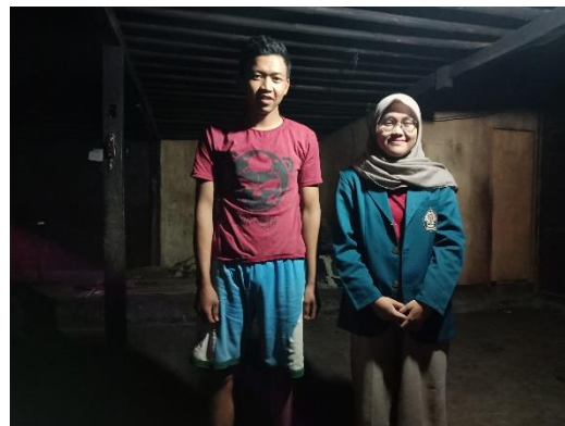
Kelompok Tani Panji Kinasih