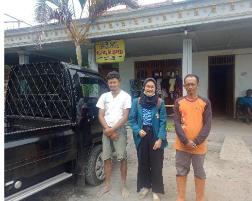
Kelompok Tani Usaha Bersama