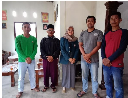
Kelompok Tani Budi Tani