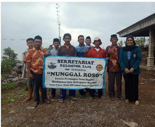
Kelompok Tani Nunggal Roso dan Alam Makmur