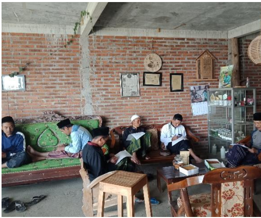
Kelompok Tani Argoayuningtani