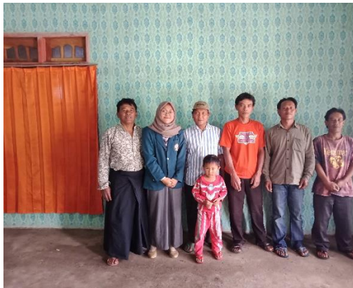
Kelompok Tani Karya Manuggal