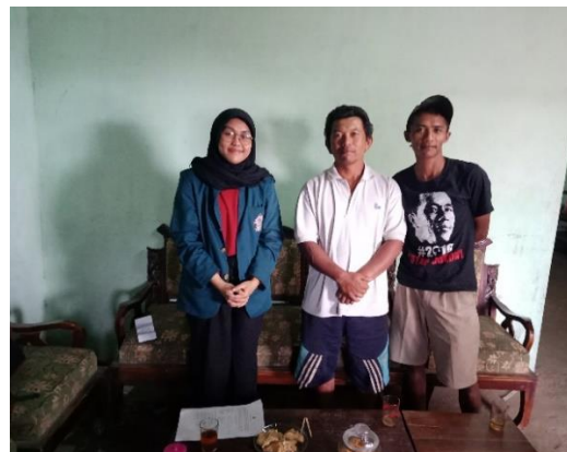
Kelompok Tani Argo Utaming Tani