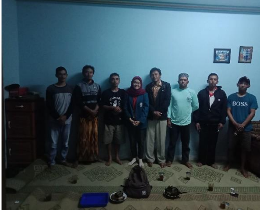
Kelompok Tani Argo Rukun