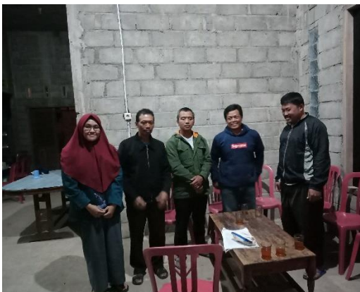
Kelompok Tani Argo Utaming Tani