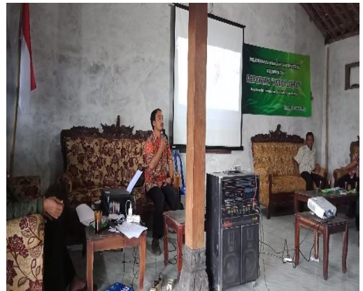
Kegiatan Penyuluhan Gapoktan Desa Senden mengenai Pelatihan Kelembagaan dan Administrasi Kelompok Tani 31 Januari 2019