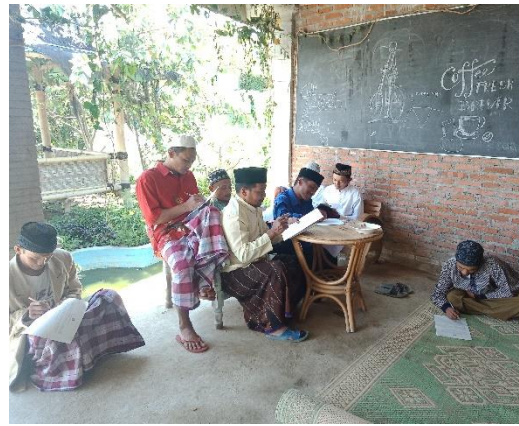
Kelompok Tani Panji Kinasih