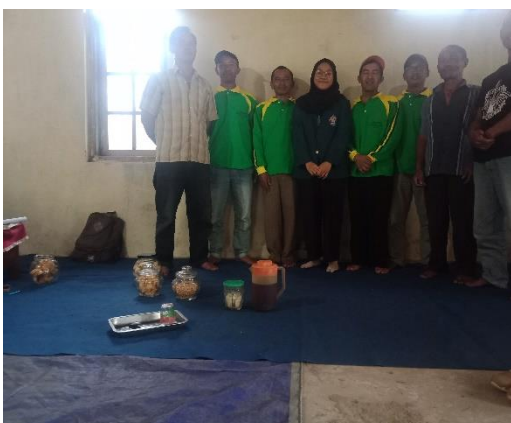
Kelompok Tani Ngudi Makmur