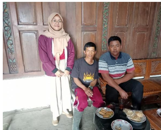
Kelompok Tani Alam Makmur