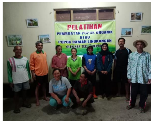
Kelompok Tani Sari Mulyo