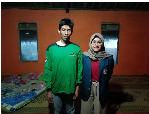
Kelompok Tani Panji Kinasih