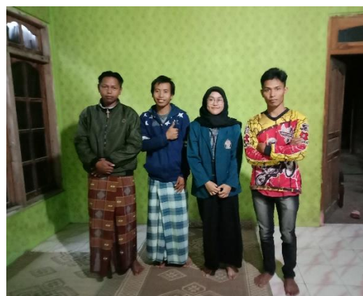
Kelompok Tani Sembada Tani