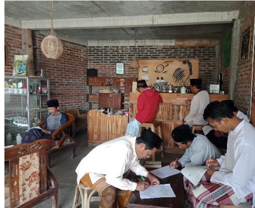
Kelompok Tani Margo Dadi