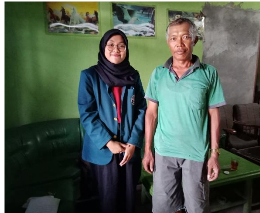
Kelompok Tani Sarana Tani