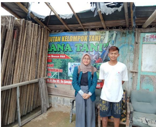
Kelompok Tani Sarana Tani