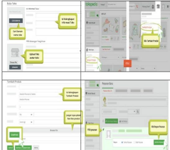
Gambar 5. Langkah-langkah membuka toko online pada tokopedia