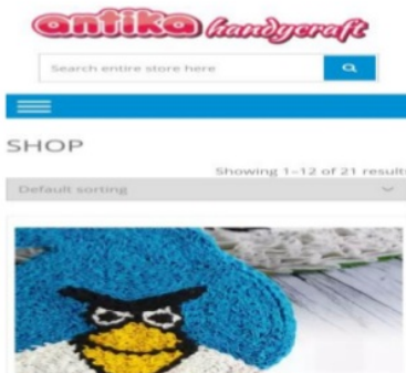
Gambar 3. Tampilan toko online mitra pada tokopedia

c. Bisnis Online melalui tokopedia atau lainnya