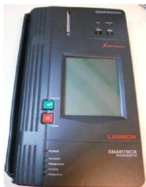
Gambar 2 Engine scanner Launch X431