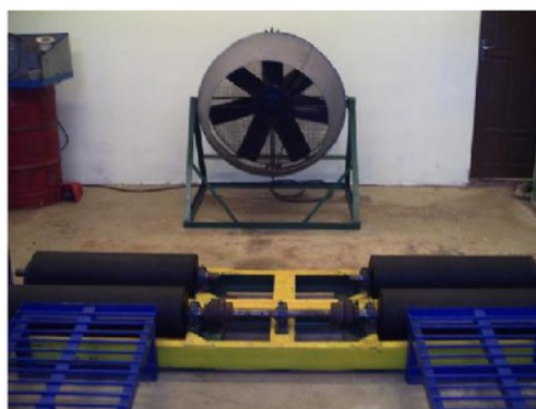
Gambar 3 Chassis roll