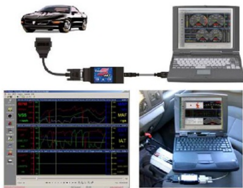
Gambar 1 Auto scanner OBD II Palmer

Alat ukur utama yang digunakan dalam penelitian ini adalah engine scanner OBD II merk Palmer dan Launch X431. Engine scanner Palmer sebenarnya lebih mudah digunakan karena langsung terhubung secara real time dengan computer laptop, seperti diperlihatkan pada Gambar 1 di bawah. Alat ini dihubungkan ke mobil melalui soket OBD II yang terdapat di bawah dash board . Adapaun penggunaan engine scanner Launch X431, seperti ditunjukkan pada Gambar 2, disebabkan karena tidak semua mobil yang diukur kompatibel dengan engine scanner Palmer. Scanner Launch X431 ini tidak terhubung secara real time ke komputer laptop. Data hasil pengukuran disimpan di dalam sebuah kartu memori (SD Card) yang dapat dibaca oleh komputer. Pengujian di laboratorium dilakukan di atas 7 buah chassis roll, seperti ditunjukkan pada Gambar 3.