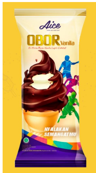
Gambar 2.22. Es Krim Obor Vanilla