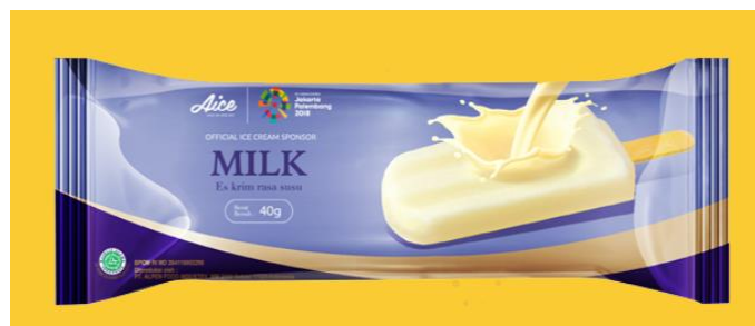
Gambar 2.12. Es Krim Milk

11. Milk , merupakan es krim stik dengan rasa susu.