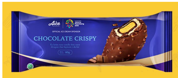
Gambar 2.3. Es Krim Chocolate Crispy