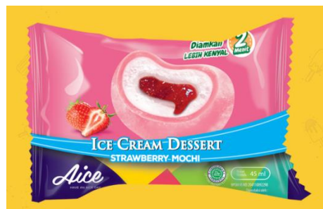
Gambar 2.24. Es Krim Mochi Strawberry

23. Mochi Strawberry , merupakan es krim mochi rasa vanilla diisi es krim vanilla dan saus stroberi.