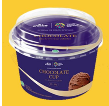
Gambar 2.6. Es Krim Chocolate Cup