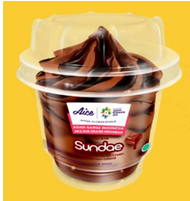
Gambar 2.25. Es Krim Coklat Sundae