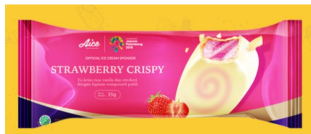
Gambar 2.5. Es Krim Strawberry Crispy