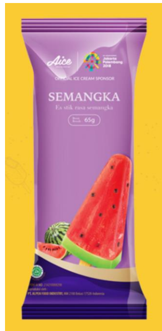
Gambar 2.18. Es Krim Semangka