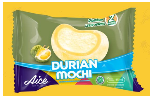
Gambar 2.20. Es Krim Mochi Durian

20. Mochi Chocolate , merupakan es krim mochi cokelat dengan isian es krim vanilla dan kukis cokelat.