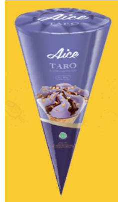
Gambar 2.10. Es Krim Taro