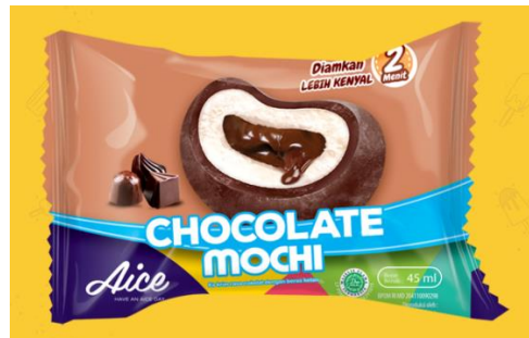
Gambar 2.21. Es Krim Mochi Chocolate