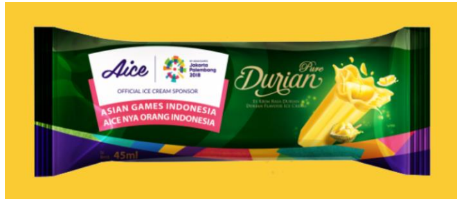
Gambar 2.13. Es Krim Pure Durian

12. Pure Durian , merupakan es krim stik dengan rasa durian asli.