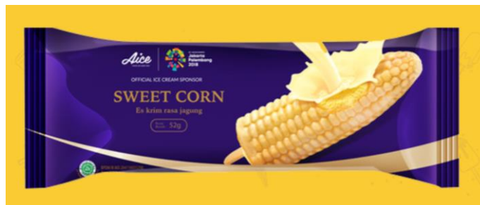
Gambar 2.11. Es Krim Sweet Corn

10. Sweet Corn , merupakan es krim rasa jagung yang manis dengan dilapisi waffle .