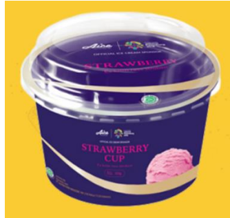
Gambar 2.8. Es Krim Strawberry Cup