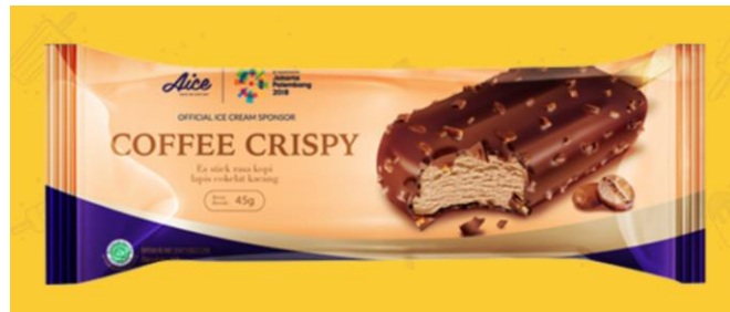
Gambar 2.2. Es Krim Coffe Crispy