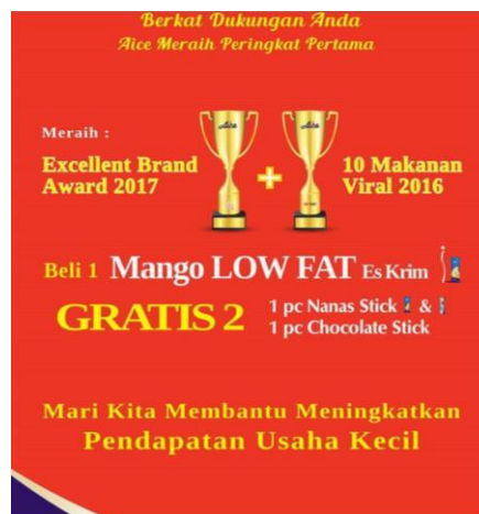
Gambar 2.26. Contoh Promo Aice Beli 1 Gratis 1 di Toko Kelontong