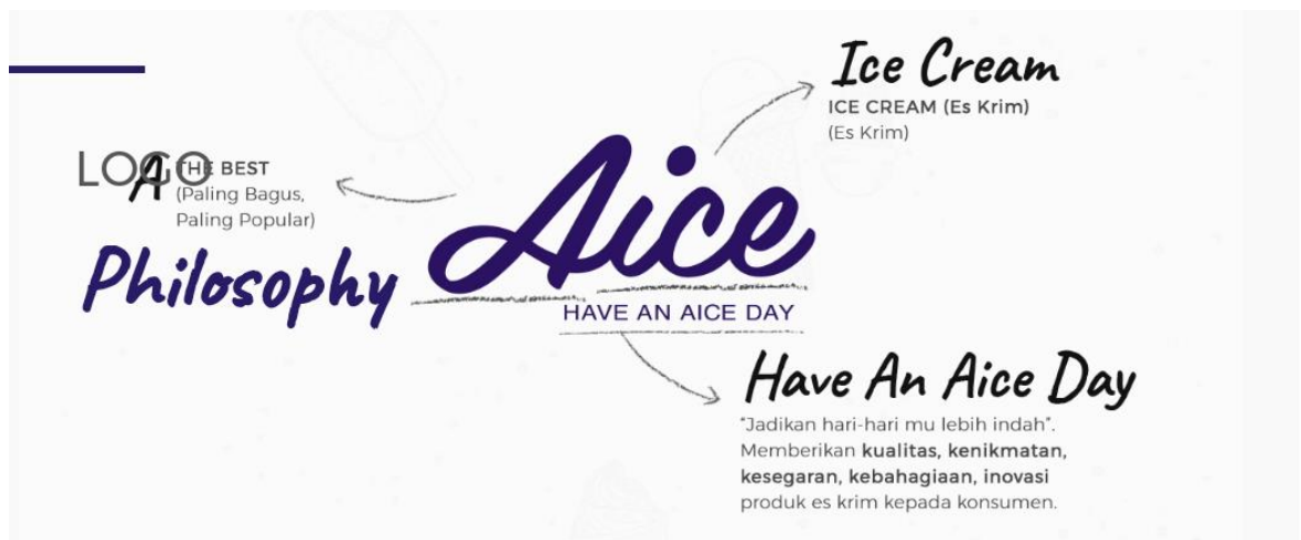
Gambar 2.1. Logo Es Krim Aice