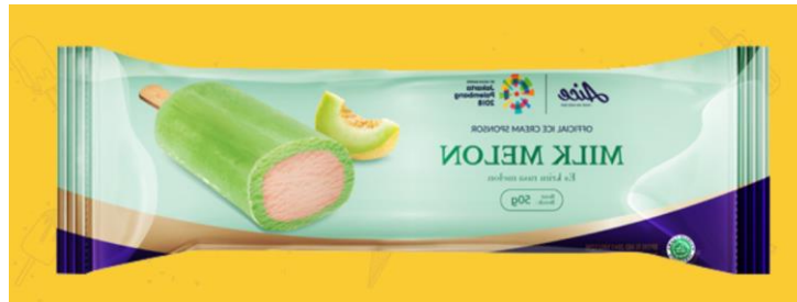
Gambar 2.17. Es Krim Milk Melon