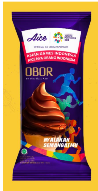
Gambar 2.19. Es Krim Aice Obor