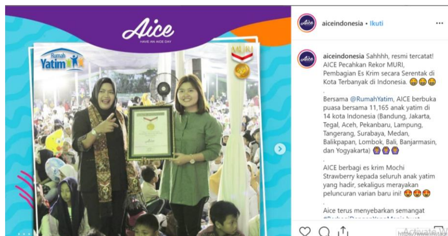
Gambar 2.32. Pemecahan Rekor Muri Aice 28 Mei 2019