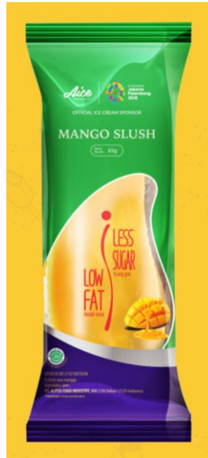
Gambar 2.15. Es Krim Mango Slush Low Fat Less Sugar