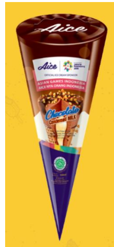
Gambar 2.9. Es Krim Chocolate Condensed