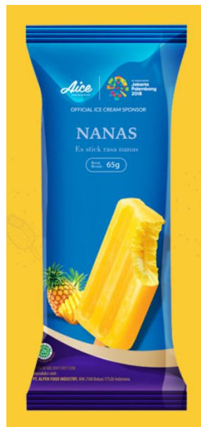
Gambar 2.16. Es Krim Nanas

15. Nanas, merupakan es krim stik dengan rasa nanas.