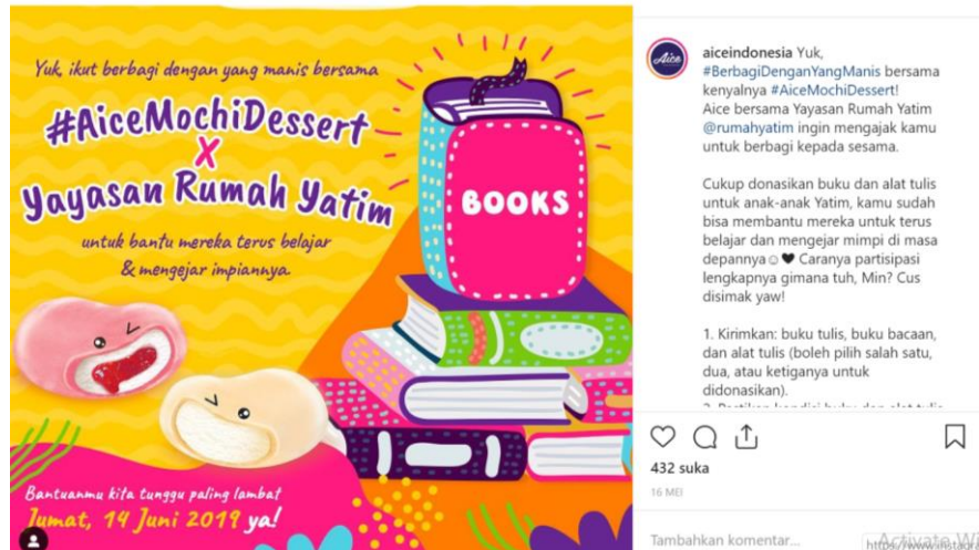
Gambar 2.31. Kegiatan Aice Bersama Yayasan Rumah Yatim 2018