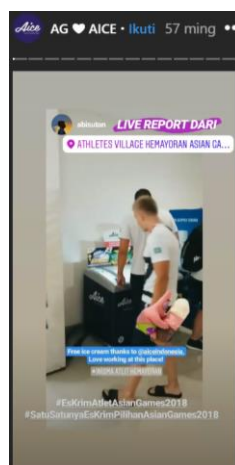
Gambar 2.28. Aice di Wisma Atlet Kemayoran saat Asean Games 2018