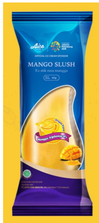
Gambar 2.14. Es Krim Mango Slush

13. Mango Slush , merupakan es krim stik dengan rasa manga asli.