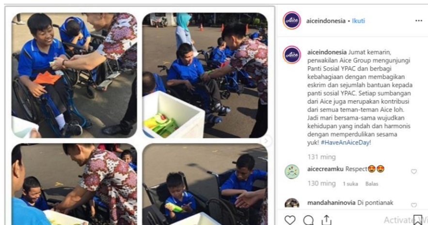
Gambar 2.30. Kegiatan Aice di Panti Asuhan YPAC 27 Maret 2017