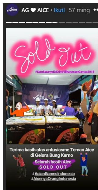
Gambar 2.33. Booth Aice di Event Asian Games 2018

Pada awal kemunculannya Aice hanya dijual di toko-toko kelontong yang tersebar di dalam pemukiman padat penduduk, sehingga sangat mendukung Aice lebih mudah dikenal oleh masyarakat. Pada perkembangannya, Aice juga dapat ditemukan di minimarket, supermarket, maupun hypermarket di seluruh Indonesia. Banyaknya toko yang menjual Aice memudahkan masyarakat yang ingin membeli produk es krim Aice dimana saja dan kapan saja.