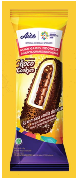
Gambar 2.4. Es Krim Choco Cookies