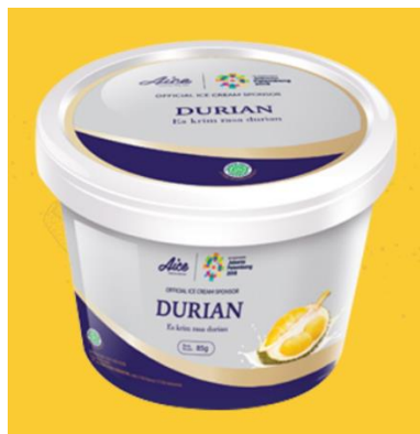
Gambar 2.7. Es Krim Durian Cup