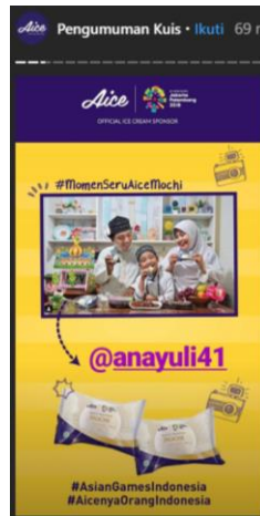
Gambar 2.27. Pemenang kuis mingguan #momenseruaicemochi periode 24-31 Mei 2018