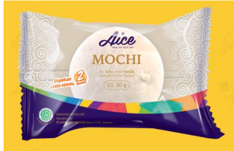
Gambar 2.23. Es Krim Mochi Vanilla