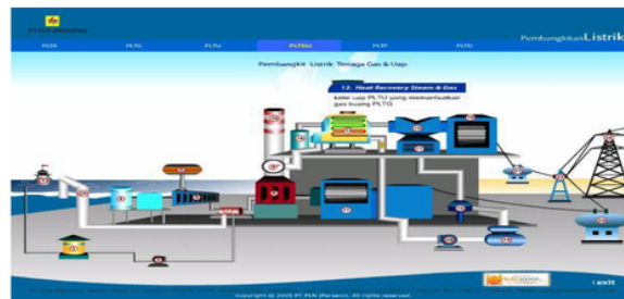
Gambar 1. Pusat Listrik Tenaga Gas dan Uap (PLTGU) [2]

Tujuan penelitian ini adalah untuk menentukan nilai exergy physical dan exergy chemical yang terjadi di HRSG dan menentukan nilai exergy destruction tiap-tiap komponen di HRSG. a.Menentukan nilai efisiensi exergy HRSG dan efisiensi energi secara keseluruhan dan efisiensi tiap-tiap komponen.