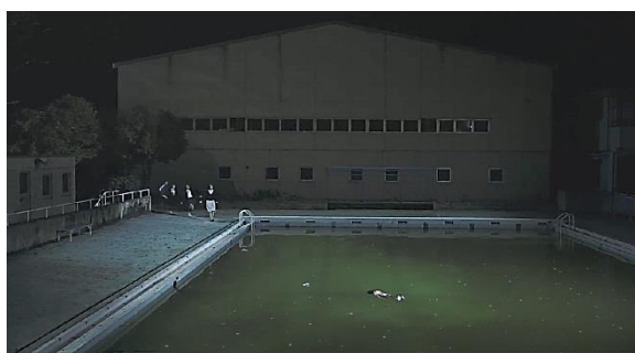
Gambar 9. Manami ditemukan meninggal di kolam renang ( Kokuhaku , 2010.00:10:30)