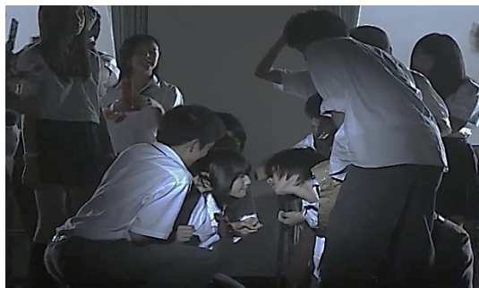
Gambar 7. Perundungan terhadap Shuuya dan Mizuki di kelas. ( Kokuhaku , 2010. 00:45:52)

Murid-murid di kelas tersebut selalu menggunakan handphone ketika proses belajar berlangsung, mereka menyembunyikannya dibawah laci meja tempat mereka duduk, kemudian saling bertukar pesan. Suatu hari, murid-murid tersebut mendapat pesan tanpa identitas pengirim yang mengatakan bahwa mereka akan mendapat poin ketika berhasil merundung Shuuya. Mizuki, salah seorang murid di kelas tersebut tidak ingin terlibat dengan hal-hal seperti itu sehingga poin miliknya nihil dan hal tersebut yang membuat dirinya ikut dirundung bersama Shuuya.