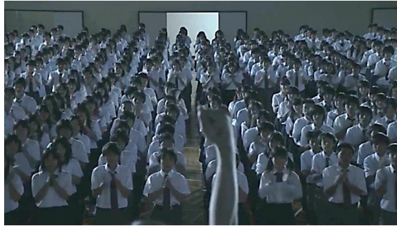
Gambar 11. Para murid bertepuk tangan setelah mendengar pidato Shuuya. ( Kokuhaku , 2010. 01:29:02)

ini. Kemudian Yuuko menghampiri Shuuya yang menangis dan mengatakan bahwa ia bercanda tentang bom yang diletakkan di ruang kerja Ibu Shuuya.