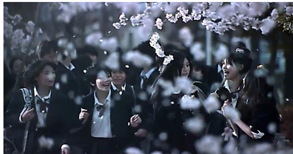
Gambar 13. Murid-murid yang sedang berjalan ke sekolah. ( Kokuhaku , 2010. 00:31:12)

menandakan sebagai sesuatu yang baru dan bahagia. Ironisnya, bermekarnya bunga sakura dan pergantian semester baru, bukan sebagai awal yang baik, melainkan sebagai tanda mulainya pembalasan dendam Yuuko terhadap Shuuya dan Naoki.