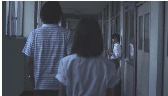
Gambar 2. Shuuya dan Mizuki bersalaman di lorong sekolah sebelum Mizuki bertemu kepala sekolah. ( Kokuhaku , 2010. 00:58:21 dan 00:59:48 )

sekolah. Setelah adegan ini pada menit 00:58:21, dilanjutkan dengan cerita dari sudut pandang Mizuki. Sementara setelah pengulangan adegan pada menit 00:59:48, dilanjutkan dengan cerita dari sudut pandang Shuuya.