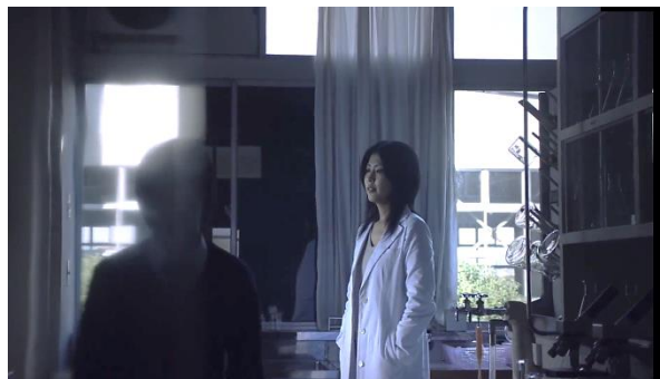
Gambar 10. Shuuya yang merasa kesal setelah menguji coba dompet buaatannya pada Yuuko ( Kokuhaku , 2010. 00:18:35)

dengan keahlian Yuuko yakni kimia. Suatu hari, Shuuya mendatangi Yuuko untuk menanyakan perihal listrik. Hal ini kemudian berkaitan dengan alat buatan Shuuya yakni dompet kejut anti maling yang digunakan untuk mencelakai Manami. Ketika Shuuya membawa dompet anti maling tersebut, ia meminta Yuuko untuk mencoba membukanya. Shuuya tersinggung dengan perkataan Yuuko yang mengatakan bahwa Shuuya menjadikan ia sebagai objek percobaannya. Shuuya kemudian mengatakan ‘ting’ sebagai perumpamaan bunyi kehilangan sesuatu, hal itu menandakan awal mula pembalasan dendam Shuuya kepada Yuuko karena telah menyinggung dirinya dan alat buaatannya.