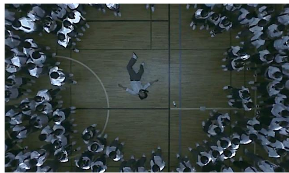
Gambar 12. Shuuya terkulai lemas setelah menerima telepon dari Moriguchi. ( Kokuhaku , 2010. 01:41:27)