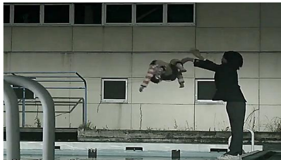
Gambar 8. Manami dilempar ke kolam renang ( Kokuhaku , 2010. 01:12:29 )

bermain bersama Mook. Shuuya kemudian memberikan dompet kejut anti maling buatannya yang menyebabkan Manami tidak sadarkan diri. Setelah itu, Manami dilempar ke kolam renang yang menyebabkan ia meninggal. Kolam renang tersebut digambarkan terlihat keruh untuk menambah kesan kelam dan mencekam ketika ditemukannya jasad Manami. Digambarkan pula dalam keadaan sepi karena jam pelajaran telah berakhir saat Manami ditemukan meninggal di dalamnya. Digambarkan anjing milik Takenaka terus menggonggong selama adegan tersebut. Anjing yang terus menggonggong menunjukkan tanda bahaya atau terdapat sesuatu yang ganjil dari pemiliknya.