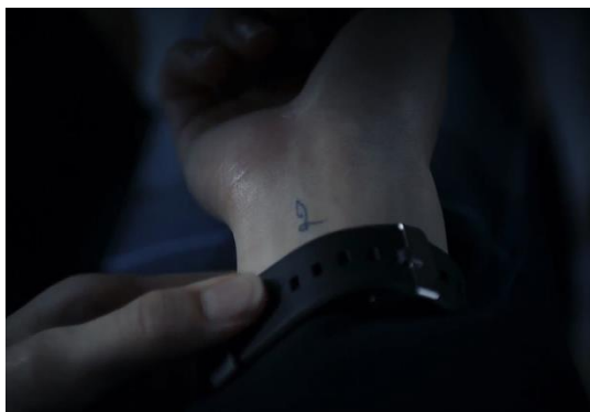
Gambar 4. Lengan Mizuki dengan tato Lunacy ( Kokuhaku , 2010. 00:13:33)

Mizuki merupakan salah seorang teman sekelas Shuuya dan Naoki. Mizuki digambarkan sebagai sosok yang misterius. Misterius menurut KBBI berarti penuh rahasia; sulit diketahui atau dijelaskan. Hal ini diperkuat dengan rahasia yang ia miliki yaitu mengenai identitasnya sebagai pembunuh dengan nama samaran “Lunacy”.