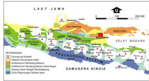
Gambar 1. Fisiografi Pulau Jawa Bagian Timur Menurut van Bemmelen (1970); Kotak merah merupakan daerah penelitian.

Lokasi penelitian meliputi seluruh area tanggul penahan Lumpur Sidoarjo dengan luas \pm 640 \text{ ha} dengan ketinggian dinding tanggul setinggi 12 meter yang berada di Desa Renokenongo dan sekitarnya, Kecamatan Porong, Kabupaten Sidoarjo, Provinsi Jawa Timur. Secara fisiografis, Sidoarjo termasuk dalam Zona Depresi Kendeng yang merupakan kelanjutan dari Zona Bogor-Serayu Utara. Zona ini mengalami uplifting serta deformasi sejak Plio-Pleistosen yang mengakibatkan terbentuknya anticlinorium, yaitu puncak lipatan besar permukaan bumi yang tersusun atas beberapa puncak lipatan kecil (Satyana & Asnidar, 2008). Fisiografis Sidoarjo dapat dilihat pada Gambar 1. Susunan stratigrafi daerah Sidoarjo dan sekitarnya dari tua ke muda adalah Formasi Ngimbang, Kujung, Prupuh, Kalibeng, Pucangan dan Endapan Aluvial.