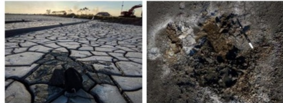
Gambar 2. Kondisi endapan lempung di lapangan

Berdasarkan analisisnya, karakteristik fisik endapan Lumpur Sidoarjo adalah memiliki nilai berat jenis yang besar yaitu antara 1,2 hingga 1,4 g/mL (Tabel 1) serta fraksi terbesar adalah lempung dengan persentase sebesar 81,5 % (Tabel 2).