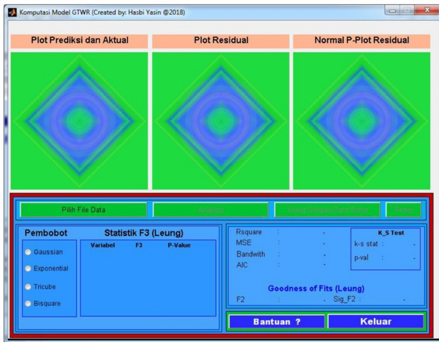
Gambar 1. Tampilan GUI GTWR

Gambar 1 menunjukkan tampilan desain antar muka GUI metode MGWR yang disusun menggunakan software MATLAB.