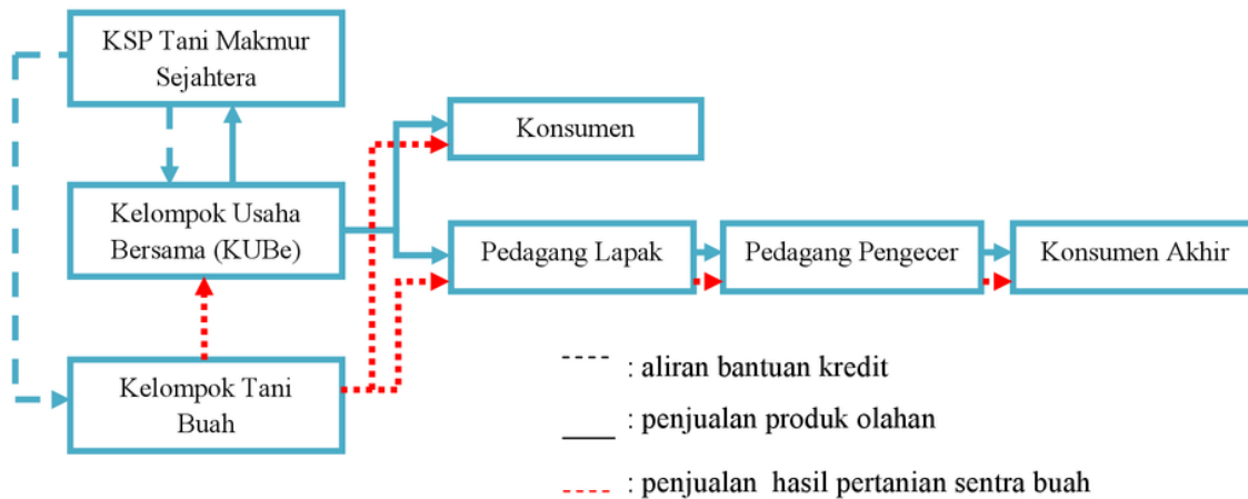
Gambar 3. Pola Aliran Permodalan dan Penjualan Hasil Pertanian Sentra Buah beserta Produk Olahannya di Desa Cabean, Kabupaten Demak.