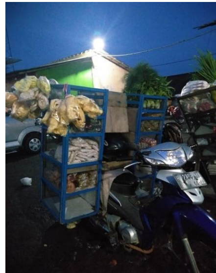
Pedagang sayur keliling