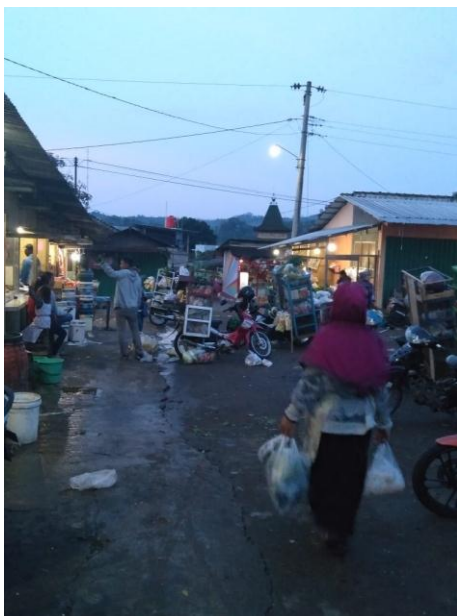
Suasana Pasar Pagi