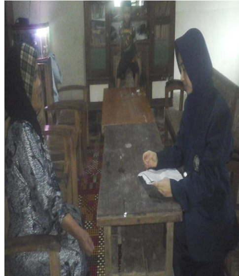
Wawancara dengan ibu rumah tangga pedagang sayur