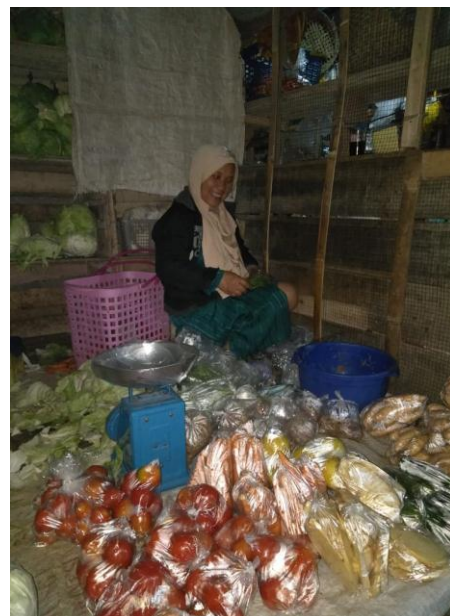
Lapak Pedagang sayur