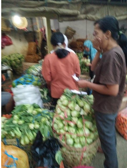
Suasana membeli dagangan