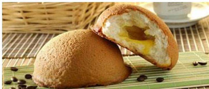
Gambar 2.3 Rotiboy Original

Roti berbentuk bulat dengan lapisan cream kopi di luar dan mentega di dalam ini menjadi produk utama Rotiboy . Produk tersebut dijual dengan harga Rp.11.000