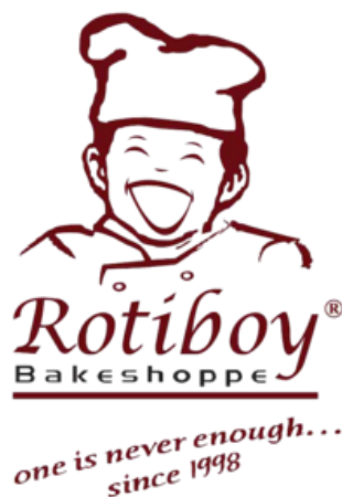
Gambar 2.1 Logo Rotiboy

Logo diibaratkan sebagai wajah dari seseorang, sedangkan keseluruhan badannya merupakan identitas (termasuk logo). Fungsi dari logo antara lain sebagai identitas diri, tanda kepemilikan, tanda jaminan kualitas, dan mencegah adanya peniruan atau pembajakan, sehingga dengan memiliki logo, perusahaan dapat menempatkan dirinya secara berbeda dengan masyarakat dan konsumen