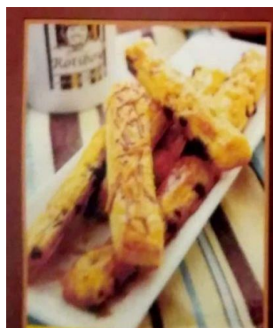
Gambar 2.6 Rotiboy Pastry Stick

Berbeda dengan roti manis lainnya, Rotiboy Pastry Stick menjadi menu alternative Roti kering dengan rasa yang agak asin dengan isian keju. Produk tersebut dijual dengan harga Rp.11.000