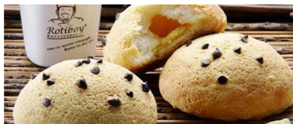
Gambar 2.4 Rotiboy Buttermilkboy

Roti berbentuk bulat dengan lapisan cream vanilla ditambah dengan butiran topping chocochip menjadi alternatif bagi konsumen yang tidak begitu menyukai kopi. Produk tersebut dijual dengan harga Rp.11.000