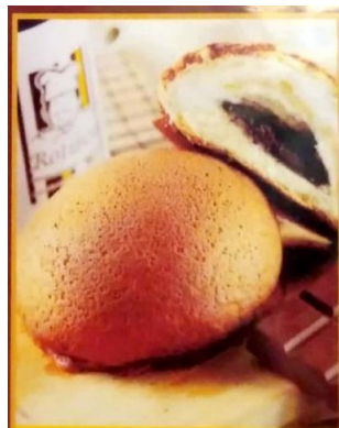
Gambar 2.5 Rotiboy Chocolate

Roti berbentuk bulat dengan lapisan krim coklat menjadi alternatif bagi konsumen yang tidak begitu menyukai kopi. Produk tersebut dijual dengan harga Rp.11.000