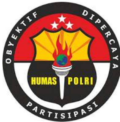
(Gambar 2.5 Logo Bidhumas Polda Jateng)

Berikut penjabaran makna dari logo Bidhumas Polda Jateng dari hasil wawancara penulis dengan personil Bidhumas Polda Jateng yang ditugaskan sebagai kepala Tata Usaha (Ka Ur Tu) :