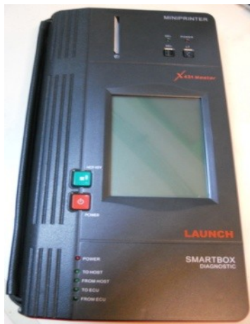
Gambar 2 Engine scanner Launch X431