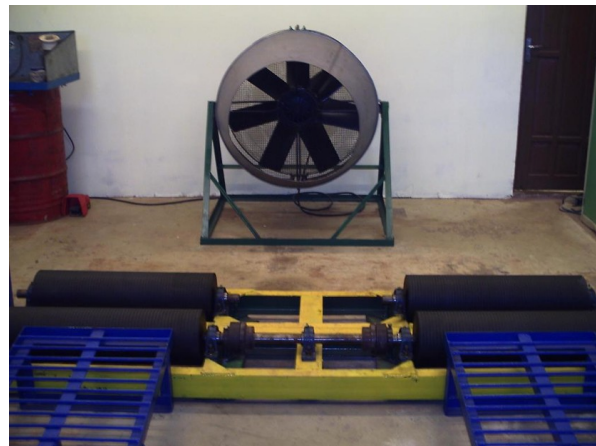
Gambar 3 Chassis roll

Alat ukur utama yang digunakan dalam penelitian ini adalah engine scanner OBD II merk Palmer dan Launch X431. Engine scanner Palmer sebenarnya lebih mudah digunakan karena langsung terhubung secara real time dengan computer laptop, seperti diperlihatkan pada Gambar 1 di bawah. Alat ini dihubungkan ke mobil melalui soket OBD II yang terdapat di bawah dash board . Adapaun penggunaan engine scanner Launch X431, seperti ditunjukkan pada Gambar 2, disebabkan karena tidak semua mobil yang diukur kompatibel dengan engine scanner Palmer. Scanner Launch X431 ini tidak terhubung secara real time ke komputer laptop. Data hasil pengukuran disimpan di dalam sebuah kartu memori (SD Card) yang dapat dibaca oleh komputer. Pengujian di laboratorium dilakukan di atas sebuah chassis roll, seperti ditunjukkan pada Gambar 3.