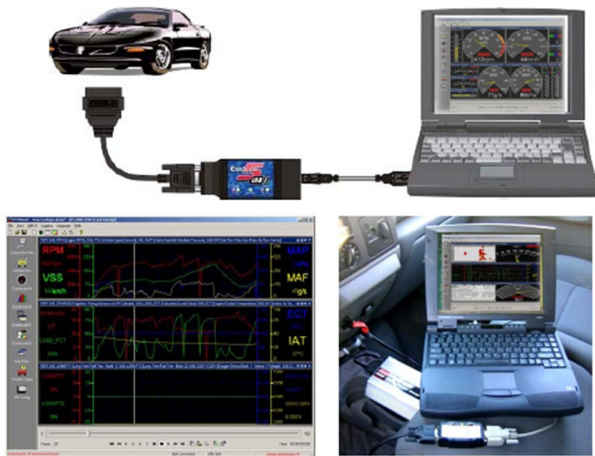
Gambar 1 Auto scanner OBD II Palmer