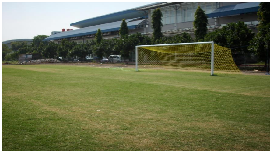
Gambar 2.2 Lapangan TerangBangsa FC