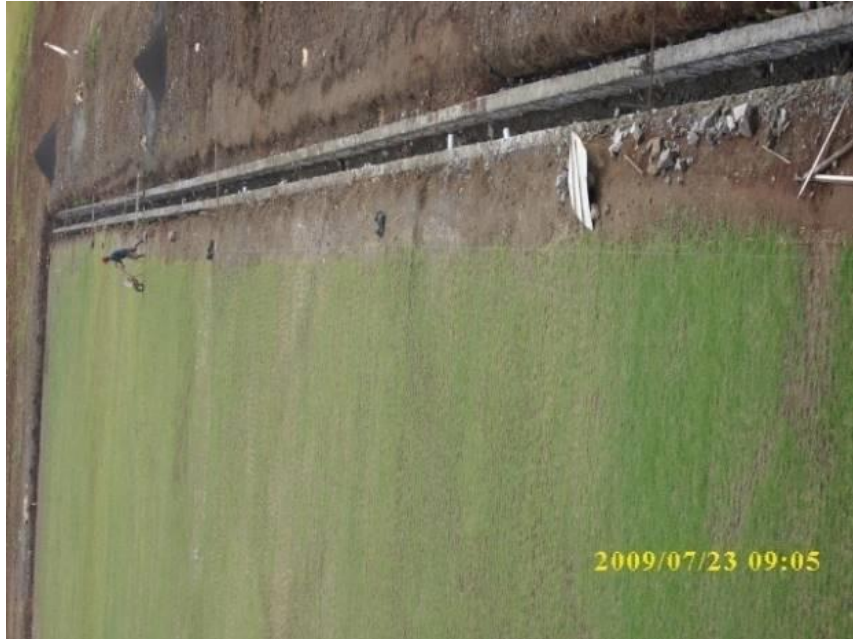
Gambar 2.1 Pembuatan gorong-gorong

berfungsi ketika hujan lebat menyirami lapangan TerangBangsa FC sehingga air dengan begitu cepat dapat terserap ke bawah.