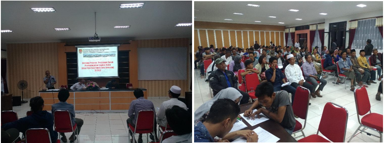
Gambar 3.6.1 Pelaksanaan Sosialisasi Peningkatan jalan dan Pengadaan tanah