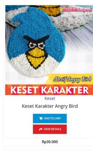
Gambar 3. Lanjutan