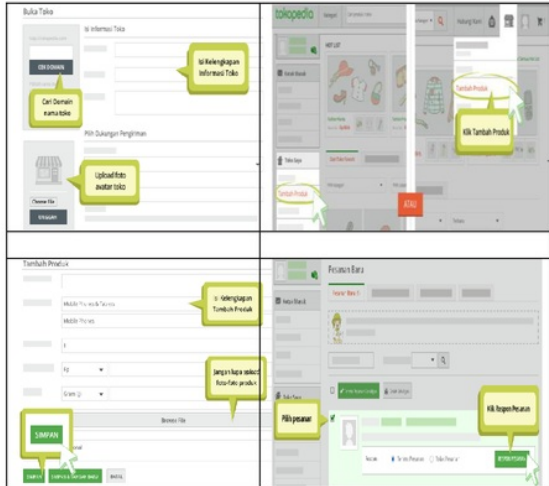
Gambar 5. Langkah-langkah membuka toko online pada tokopedia