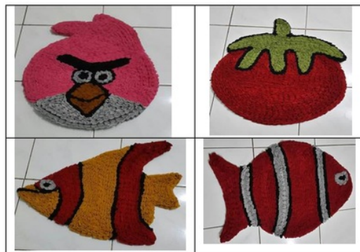
Gambar 1. Produk keset karakter dari kain perca

Untuk mempertahankan dan meningkatkan omzet penjualan keset ke konsumen perlu dilakukan usaha penyempurnaan dan perubahan produk yang dihasilkan melalui kreasi dan inovasi ke arah yang lebih baik, sehingga dapat memberikan daya guna dan daya pemuas serta daya tarik yang lebih besar terhadap konsumen. Selain itu jumlah putaran jahitan yang diterapkan pada setiap model setiap keset perlu dijaga konsistensinya agar standar kualitas tetap terjaga.