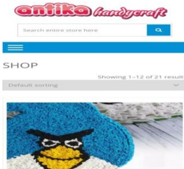
Gambar 3. Tampilan toko online mitra pada tokopedia

c. Bisnis Online melalui tokopedia atau lainnya