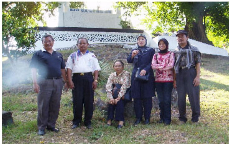
GAMBAR 1. Penulis di depan makam Sultan Murhum di Bau-Bau Buton

apene a sambahea jumaa yi Taranate asawi kapala wasalamata”, iaitu Sultan Wolio melakukan salat Juma’at di Ternate (Zuhdi 1999:67; Said 2005:12). Bukti lain tentang hubungan erat Buton-Ternate ialah kesamaan nama Sultan Buton I bernama Murhum dan Sultan Ternate yang bernama Marhum. Menurut Hamka (1981) Raja Ternate yang bernama Kolano Gapi Baguna masuk Islam atas seruan Datuk Maulana Hussein dan menggelar diri dengan nama Islam Marhum. Sultan Ternate yang berkuasa antara 1465-1486 adalah sultan yang kuat menjalankan pemerintahan berasaskan ajaran agama. Bukti lain tentang kuatnya hubungan antara Buton-Ternate ialah tempat persembunyian Aru Palaka di Buton. Lihat foto di bawah ini: