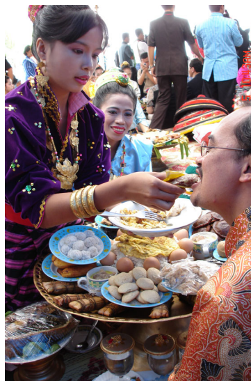
GAMBAR 2. Penulis dalam upacara Pakande-kande di Keraton Buton

Berdasarkan nilai tersebut, dapatlah difahami sebab umat Islam akomodatif terhadap budaya pra-Islam. Selain nilai-nilai itu tidak bertentangan dengan ajaran Islam, umat Islam Buton hidup dalam budaya Islam yang kooperatif. Antara tradisi budaya Islam Buton yang kekal sehingga kini adalah upacara Pakade-kande , upacara tradisional mengenai peminangan laki-laki terhadap perempuan. Caranya ialah perempuan itu memberi layanan dengan menyuapkan makanan kepada laki-laki sebagai tanda selamat datang, seperti yang ditunjukkan dalam foto di bawah ini: