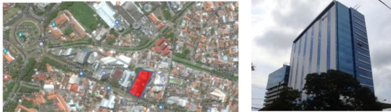
Gambar 1 : Lokasi Menara Suara Merdeka

Pada proses pengumpulan dan analisa data menggunakan pendekatan kualitatif dengan wawancara informan yaitu pemilik gedung, arsitek, kontraktor, karyawan gedung, observasi, dan pengukuran lapangan. Dari hasil wawancara dan observasi kemudian dipadukan dengan parameter GreenShip Exsiting Building versi 1.1 dari Green Building Council Indonesia sehingga didapatkan tema pembahasan penelitian. Lokasi penelitian berada di Jl. Pandanaran No. 30 Semarang, Jawa Tengah.