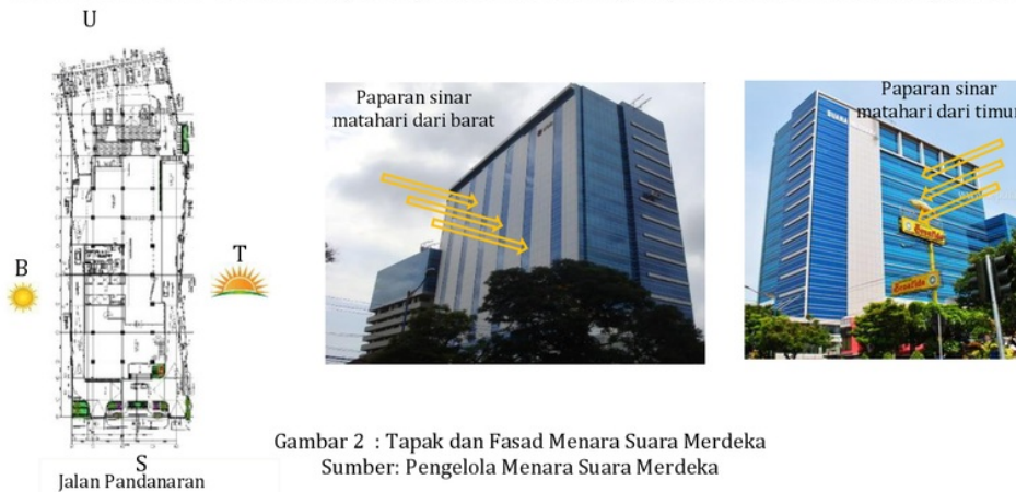
Gambar 2 : Tapak dan Fasad Menara Suara Merdeka

Orientasi bangunan mengikuti bentuk tapak dengan memanjang ke utara dan selatan, dan menghadap ke selatan yaitu menghadap ke jalan utama Jalan Pandanaran. Keterbatasan lahan dan sisi kanan kiri tapak yang telah terisi bangunan menjadi alasan gedung tidak dapat berorientasi memanjang ke arah timur dan barat. Sisi panjang bangunan menghadap ke arah timur dan barat, sehingga pada fasad timur dan barat diperlukan shading berupa material khusus untuk mengurangi sinar matahari yang masuk ke dalam bangunan.