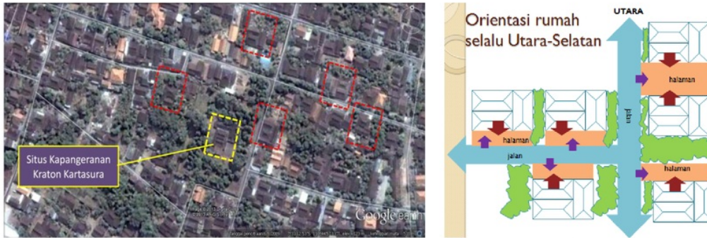
Gambar 1. Orientasi bangunan rumah-rumah vernakuler di Jawa pada umumnya menghadap ke utara-selatan, tidak terpengaruh posisi jalan.

Sangat dimungkinkan pola jalan yang melingkari gunung dipengaruhi oleh faktor topografi. Tetapi jika kemudian dibandingkan dengan orientasi rumah vernakuler pada umumnya yang mengabaikan faktor 'posisi jalan' atau 'semacam memaksakan diri' untuk mendapatkan orientasi ke Utara atau Selatan, maka orientasi konsentrik di Majasto juga berbeda dalam hal ini.