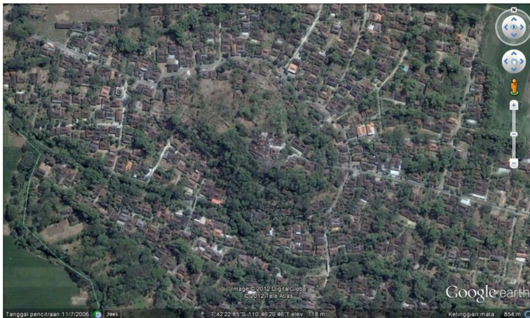
Gambar 2. Pola permukiman di Desa Majasto berpola konsentrik, rumah-rumah beorientasi ke Nggumung

Kedua konfigurasi lanskap di atas (di Nggumung dan perkampungan) berbeda dengan pakem konfigurasi pusat permukiman Jawa. Terdapat anomali pola lanskap di Majasto. Arsitektur Jawa baik dalam konteks kawasan maupun building (rumah) senantiasa didasarkan pada kosmologi Jawa yang memperhatikan konsep moncopat , papat kiblat kalima pancer (Behrend, 1986; Wondoamiseno, 1986); Setiawan E. , 2000, Widayatsari, 2002; Kartono, 2005; Handinoto, 1992; Damayanti & Handinoto, 2005; Santoso, 2008; Djono & Utomo, 2010, Rahadhian, 2008 dan Hatma I.J., 2012). Konsep ini menghasilkan beberapa perwujudan arsitektur, antara lain: (1) dalam usaha menjaga keseimbangan dengan adanya poros sakral Utara-Selatan; (2) Rumah tinggal di daerah Yogyakarta dan Surakarta kebanyakan menghadap ke Utara atau Selatan; (3) arah Timur khusus dipergunakan untuk keraton; dan (4) rumah menghadap ke Barat harus di hindari karena secara simbolik berarti mengharap