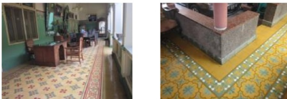
Gambar 11: Lantai pada rumah Jawa modern di Laweyan, bagaikan membatik di atas tanah.

Lantai rumah Jawa di Laweyan ber-level cukup tinggi dari permukaan tanah halaman. Cara ini sangat tepat untuk mengatasi kelembaban dan tentunya menghindari banjir. Pelapisan lantai pada rumah Jawa modern di Laweyan tidak sekedar mengatasi kelembaban dari bawah tanah, namun juga merupakan media untuk berekspresi. Pemasangan lapisan lantai itu bagaikan membatik di atas permukaan bumi. Permainan motif pada kain batik menginspirasi orang Laweyan untuk mengaplikasikan cara tersebut dalam pemasangan lantai. Bahan lantai ini berasal dari batu granit olahan dan semen teraso yang awalnya diimpor langsung dari luar negeri. Belakangan tegel bermotif batik bisa diproduksi di daerah Yogyakarta.