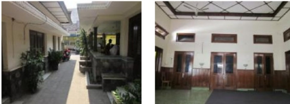
Gambar 10: Ada kombinasi karakter 'permanen' dan 'sementara' dalam pelapisan dinding rumah Jawa modern di Laweyan.

Hal lain yang terlihat penting adalah karater bangunan dari luar secara umum terlihat lebih kokoh, lebih permanen dan abadi, seperti karakter candi. Sedangkan karakter bagian dalam lebih alami dengan pelapis papan kayu jati yang meskipun sangat awet tetapi bisa rusak. Ada kombinasi dan permainan yang sangat menarik antara 'permanensi' dan 'kesementaraan' dalam pengembangan rumah Jawa modern di Laweyan.