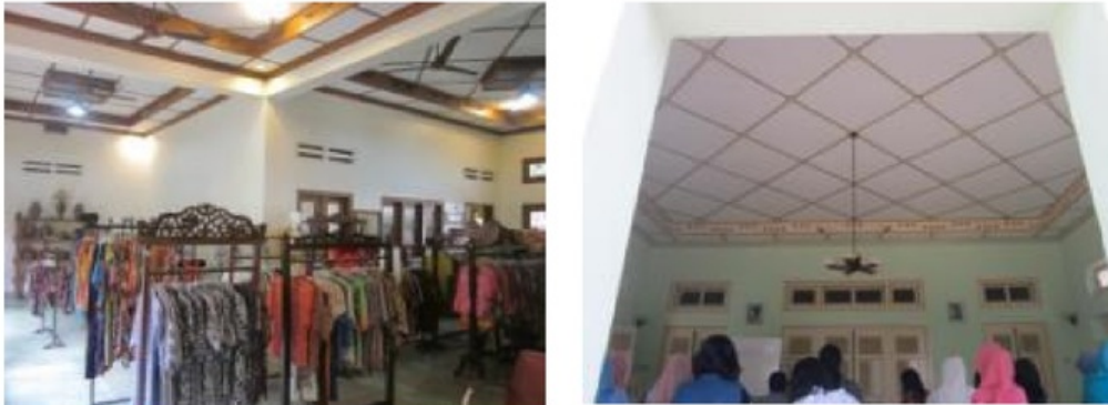
Gambar 5: Desain yang menarik pada penyelesaian bukaan pintu, jendela dan langit-langit. Variasi bentuk, bahan dan warna memperkaya suasana rumah tradisional yang modern.