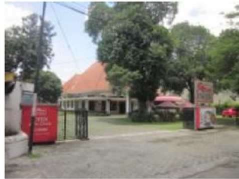
Gambar 3: Tanaman dan ruang luar yang direncanakan dan disain cukup baik dan menampilkan suasana modern yang sejuk dan asri.

Hampir selalu ada pohon cukup besar dan rindang untuk perlindungan terhadap silau dan panas matahari. Beberapa ada yang baru diremajakan karena yang lama sudah terlalu tua. Sedangkan tempat yang tidak memungkinkan ditanami pohon, cukup dengan tanaman perdu atau tanaman rambat. Tanaman ini bisa menetralsir radiasi atau konveksi panas matahari, tampias air hujan, maupun kencangnya hembusan angin. Ruang luar tersebut pada umumnya direncanakan dan disain cukup baik sehingga menampilkan suasana modern yang sejuk dan asri.