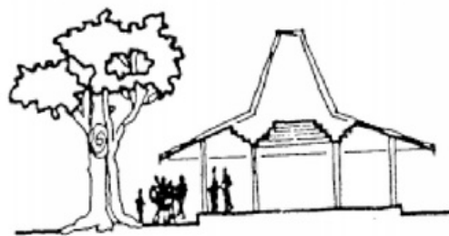
Gambar 2: a. Upacara selamat pada suatu tahap pembangunan rumah Jawa modern di Laweyan; b. Arsitektur Jawa sebagai arsitektur yang holistik