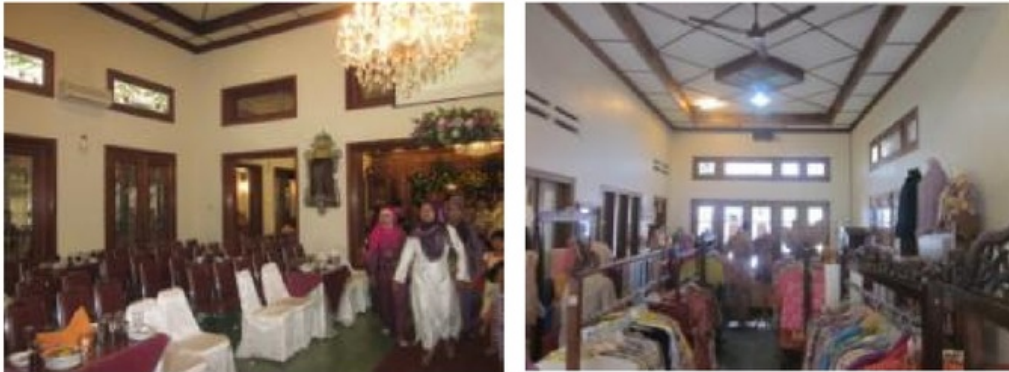
Gambar 4: Karena cukup luas dan besar, beberapa rumah modern di Laweyan disewakan untuk tempat pesta pernikahan adat Jawa (kiri) dan dipakai untuk showroom (kanan).

Pemikiran perwujudan kesan menjulang dan ruang yang lapang tidak terbatas pada bentuk atap, tetapi lebih leluasa pada peninggian dinding luar. Pada rumah Jawa lama dengan konstruksi kayu suana lapang dan tinggi hanya didapatkan apabila berada di bagian tengah rumah Jawa, atau di area sokoguru. Sedangkan apabila di daerah pinggiran ketinggian ruang terasa kurang. Untuk meningkatkan volume ruang pinggiran diperlukan peninggian dinding luar menyamai ketinggian sokoguru, bahkan lebih, sekitar 4,5 meter. Ketinggian dinding itu bisa diwujudkan dengan bahan modern. Hal inilah awalnya adanya perubahan mendasar bentuk bangunan secara keseluruhan, yaitu dinding luar atau badan bangunan lebih dan atap menjadi lebih pendek. Akan tetapi usaha untuk memperbesar volume ruang ini merupakan pemikiran yang konsisten tentang suasana yang nyaman dibawah naungan “pohon yang tinggi dan rindang”.