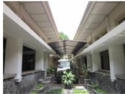
Gambar 7: Keberadaan beranda sangat membantu kegiatan insidental, seperti perayaan (kiri). Teritisan bersusun lebih efektif mengatasi sinar matahari langsung dan tampias air hujan yang berlebihan (kanan).