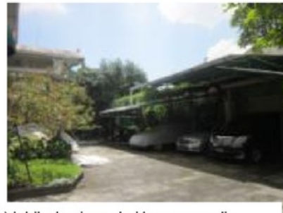
Gambar 9: Rumah utama (dalam dan pendopo) lebih dominan dari bangunan di sekelilingnya (bangunan gandok)

Penggunaan atap metal atau jenis atap genteng biasa hanya untuk bangunan sekunder seperti garasi atau pabrik. Atap metal digunakan pada bangunan yang bersifat terbuka, sehingga radiasi panas dengan segera terhembus angin. Bangunan ini pada umumnya juga bersifat sementara.