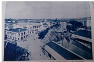
Gambar 4. Boom Kecil dengan Perkantoran Dagang Belanda (Cameron, 1917)

Kawasan Kota Lama menggunakan konsep waterfront dari dahulu hingga sekarang, dapat diperkuat pula dari Tabel 1. Berdasarkan konsep waterfront dari Wreen (1983), kawasan waterfront berkembang dari arah perairan dan kemudian mulai ramai dikunjungi hingga muncul sarana penunjang. Letak Kawasan Kota Lama dekat dengan kawasan Boom Lama sebagai pintu masuk pelabuhan Kota Semarang (Gambar 4). Juga terdapat Boom Kecil dan Jembatan Mberok sebagai kawasan yang ramai sebagai aktifitas perekonomian dan pemerintahan di kawasan tersebut. Semakin lama semakin ramai hingga muncul sarana penunjang yakni dibangunnya kantor-kantor perdagangan, kantor bea cukai, kantor pengawas pelayaran, dan juga tempat pergudangan yang digunakan untuk menyimpan barang dagang sebelum didistribusikan ke wilayah Kota Semarang (Seperti ke Pasar Padamaran, ke Pasar Johar, dan wilayah permukiman yang dilewati Kali Semarang) yang berorientasi ke Kali Semarang.