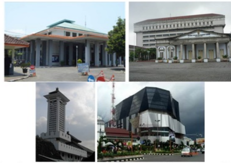
Gambar 9. Kombinasi Perkantoran, Kebudayaan, dan Rekreasi di Kampung Sekayu (dokumentasi, 2013)

Namun setelah dilaksanakan proyek normalisasi, dilihat dari konsep waterfront oleh Breen (1996), berdasarkan fungsinya Kampung Sekayu dapat dikategorikan dalam jenis Mixed-Used Waterfront karena merupakan kombinasi dari permukiman, perkantoran, kebudayaan, dan rekreasi (Gambar 9).