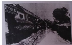
Gambar 6. Kampung Pecinan di Kawasan Klenteng Tay Kak Sie (Budiman, 1979)

Perlu diketahui bahwa warga Tionghoa tidak aman untuk tinggal di Semarang pada saat itu, karena mereka buronan Belanda. Rumah etnis Tionghoa pada Kampung Pecinan umumnya memiliki 3 pintu, yakni pintu utama di depan rumah, pintu samping yang bisa menembus ke tetangga, dan pintu belakang yang bisa langsung ke Kali Semarang. Jika dalam keadaan terdesak, mereka dapat melarikan diri langsung ke tetangga maupun langsung ke Kali Semarang (hasil wawancara, 2014). Hal ini juga membuktikan bahwa keadaan sosial politik turut mempengaruhi bentuk permukiman etnis Tionghoa di Kampung Pecinan.