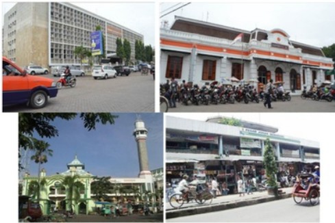
Gambar 8. Kombinasi Perkantoran, Kebudayaan, dan Perdagangan di Kampung Kauman (dokumentasi, 2013)

Namun setelah dilaksanakan proyek normalisasi, dilihat dari konsep waterfront oleh Breen (1996), berdasarkan fungsinya Kampung Kauman dapat dikategorikan dalam jenis Mixed-Used Waterfront karena merupakan kombinasi dari permukiman, perkantoran, perdagangan, dan tempat kebudayaan (Gambar 8).