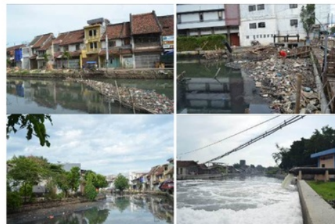
Gambar 2. Kali Semarang

Telah dilaksanakan proyek normalisasi sepanjang Kali Semarang tahun 1980 dengan membuat jalan inspeksi sebesar 7 meter pada bantaran sungai dan mencanangkan konsep waterfront pada permukiman di bantarannya. Proyek ini telah berhasil menata Kali Semarang (Gambar 2) menjadi lebih bersih dan teratur. Beberapa bangunan yang semrawut menjorok ke sungai hilang. Namun hal ini tidak bertahan lama, karena lama-kelamaan pun muncul bangunan-bangunan ilegal di bantaran sungai, serta muncul sampah-sampah yang menyumbat saluran Kali Semarang . Oleh karena itu penelitian ini bertujuan untuk mengetahui penerapan konsep waterfront pada Kampung Melayu, Kota Lama, Kampung Pecinan, Kampung Kauman, dan Kampung Sekayu.