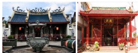
Gambar 7. Bangunan Konservasi di Kampung Pecinan

Namun setelah dilaksanakan proyek normalisasi, dilihat dari konsep waterfront oleh Breen (1996), berdasarkan fungsinya Kampung Pecinan dapat dikategorikan dalam jenis Historical Waterfront karena dikembangkan ke arah konservasi bangunan sejarah yang ada dalam kawasannya (Gambar 7).