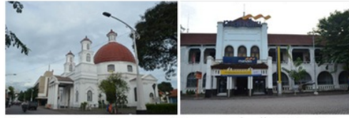
Gambar 5. Bangunan Konservasi di Kota Lama (dokumentasi, 2013)

Sedangkan jika dikaji dari konsep waterfront oleh Breen (1996), berdasarkan fungsinya, waterfront Kawasan Kota Lama dahulu dapat dikategorikan dalam jenis Working Waterfront , dimana di dalamnya terdapat fungsi-fungsi pelabuhan dan komersial, serta permukiman dan perdagangan. Namun jika dilihat setelah dilaksanakannya proyek normalisasi, waterfront Kawasan Kota Lama dahulu dapat dikategorikan dalam jenis Historical Waterfront karena dikembangkan ke arah konservasi bangunan sejarah yang ada dalam kawasannya (Gambar 5).