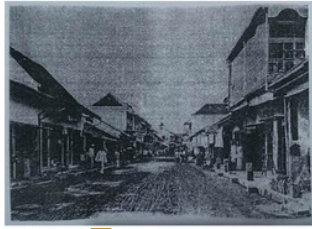
Gambar 3. Fungsi permukiman dan Perdagangan di Kampung Melayu (Panitia Reuni 100 Tahun HBS V Semarang, 1977)