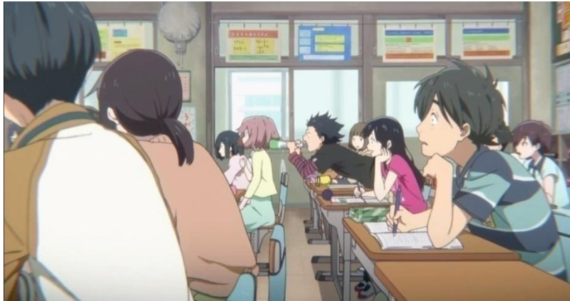
Gambar 3.16. Macam-macam ijime yang dilakukan tokoh Ishida Shouya (11:58-14:33)

Selain menjadi tokoh utama, tokoh Ishida Shouya merupakan tokoh protagonis dan antagonis. Hal ini terjadi karena terdapat 3 masa dalam anime Koe no Katachi , meskipun pada masa SMP hanya diperlihatkan sebagai kilas balik saja. Tokoh Ishida Shouya merupakan tokoh antagonis pada masa SD. Sifat buruknya terlihat ketika dia mulai melakukan ijime pada tokoh Nishimiya Shouko. Perhatikan gambar-gambar berikut ini.