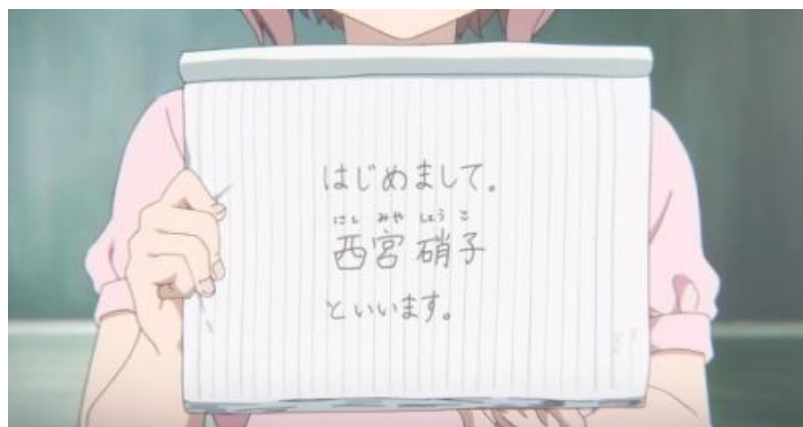
Gambar 3.2. Nishimiya Shouko memperkenalkan diri di kelas (04:03-05:40)

Potongan gambar di atas terjadi pada awal film yang menceritakan tentang pertemuan pertama tokoh Ishida Shouya terhadap tokoh