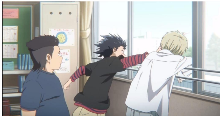
Gambar 3.36. Tokoh Ishida Shouya menjahili tokoh Nishimiya Shouko (11:58-14:33)

e. Meskipun menjadi korban ijime tokoh Nishimiya Shouko tidak pernah melawan orang-orang yang telah melakukan ijime kepada dirinya. Sifatnya tersebut justru menjadi sebuah konflik di mana tokoh Ishida Shouya dan teman-temannya terus-menerus melakukan ijime kepada tokoh Nishimiya Shouko. Hal ini terbukti melalui gambar berikut ini.