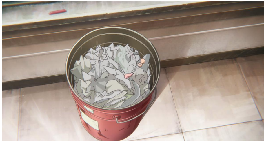
Gambar 3.28. Alat-alat pendengaran yang dibuang oleh Shouya (14:00-14:20)

akhirnya terkena ijime di kelasnya. Selain itu kehidupan keluarga Shouko digambarkan sebagai keluarga dari kalangan menengah atas. Hal ini dapat terlihat melalui ibunya Shouko yang terus-menerus mampu membeli alat pendengaran Shouko yang dibuang maupun dirusak oleh Shouya.