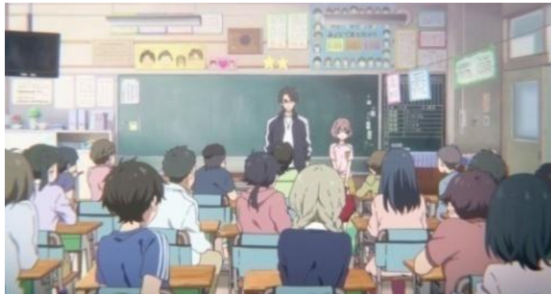
Gambar 3.1. Nishimiya Shouko memperkenalkan diri di kelas (04:03-05:40)