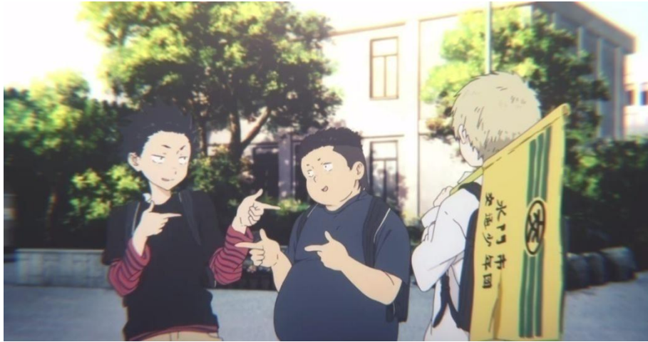
Gambar 3.40. Kebutuhan akan Cinta dan Keberadaan tokoh Ishida Shouya (02:38-02:47)

Gambar-gambar di atas menunjukkan tentang kebutuhan akan cinta dan keberadaan tokoh Ishida Shouya saat masih duduk di bangku SD. Kedua gambar di atas menunjukkan pertemanan tokoh Ishida Shouya yang begitu akrab, baik di lingkungan sekolah maupun di lingkungan rumahnya. Pada gambar 3.39, menunjukkan tentang persahabatan tokoh Ishida Shouya yang begitu akrab sehingga mereka bermain di rumah Shouya sebagai hal yang biasa. Bahkan keakraban ini terus berlanjut hingga di sekolahnya yang sesuai pada gambar 3.40.