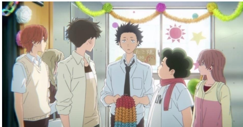
Gambar 3.15. Kemunculan Shouya di akhir cerita (2:03:35-2:03:41)

Gambar-gambar di atas menunjukkan intensitas kemunculan Shouya lebih banyak dari tokoh lain. Mulai dari awal anime berlangsung pada menit 00:58 hingga menit 03:56, tokoh Ishida Shouya telah dimunculkan. Kemudian pada pertengahan anime dimana konflik mulai muncul pada menit 31:28 hingga menit 31:53, tokoh Ishida Shouya masih ditampilkan. Lalu pada bagian akhir anime dimana konflik sudah berhasil diselesaikan pada menit 2:03:35 hingga 2:03:41, tokoh Ishida masih juga ditampilkan.