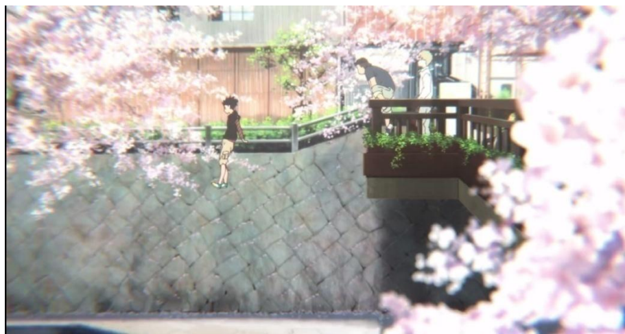
Gambar 3.38. Kebutuhan akan keamanan tokoh Ishida Shouya (02:47-03:12)

Setelah berhasil memenuhi kebutuhan fisiologisnya, tokoh Ishida Shouya juga berhasil memenuhi kebutuhan akan keamanannya di masa SD. Hal ini dapat dibuktikan pada gambar berikut ini.