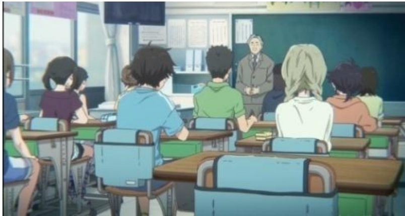
Gambar 3.5. Akibat dari ijime yang dilakukan Shouya (16:03-22:48)

pendengaran Shouko secara paksa dan mengakibatkan telinganya berdarah.