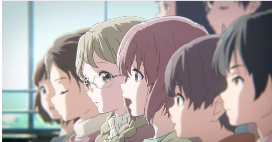
Gambar 3.33. Latihan paduan suara murid kelas 6-2 (06:56-07:35)

terjadilah konflik di mana mereka harus mengulang beberapa kali setiap latihan. Hal ini dapat dibuktikan melalui adegan berikut ini.