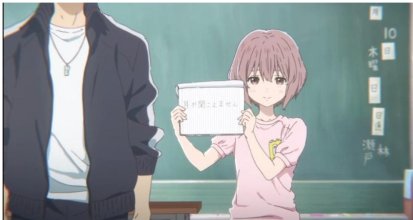
Gambar 3.9. Nishimiya Shouko menjelaskan ketidakmampuannya (04:03-05:40)

Anime Koe no Katachi dimulai ketika tokoh utama sedang duduk di bangku kelas 6 SD. Di kelasnya tiba-tiba datang murid baru bernama Nishimiya Shouko yang merupakan seorang penyandang disabilitas. Tulisan yang tertera di buku pada gambar diatas adalah mimi ga kikoemasen 耳が聞こえません yang berarti dia tidak dapat mendengar. Pada masa ini terdapat sebuah peristiwa sosial dimana tokoh Nishimiya Shouko menjadi korban ijime karena teman-teman mereka tidak dapat bertoleransi dengan penyandang disabilitas.