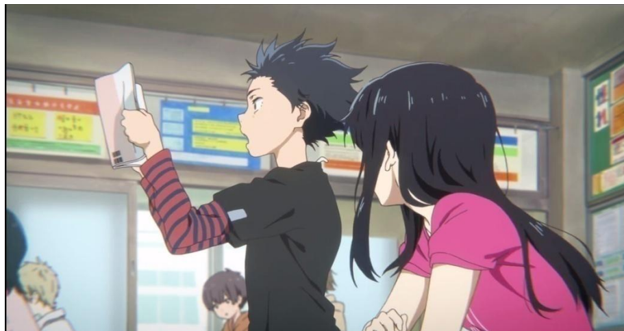
Gambar 3.41. Kebutuhan akan penghargaan tokoh Ishida Shouya (08:28-09:20)

Reputasi yang dimiliki tokoh Ishida Shouya adalah seseorang yang berani mengekspresikan bahwa dirinya tidak menyukai tokoh Nishimiya Shouko. Hal ini membuat beberapa murid berani untuk melakukan hal yang sama. Lalu, penghargaan diri tokoh Ishida Shouya adalah perasaan pribadinya bahwa dirinya berkuasa di kelasnya, hal ini dapat dilihat dari sikapnya yang terus-menerus menjahili tokoh Nishimiya Shouko yang berbeda dari anak-anak di kelasnya. Perhatikan gambar-gambar berikut ini.