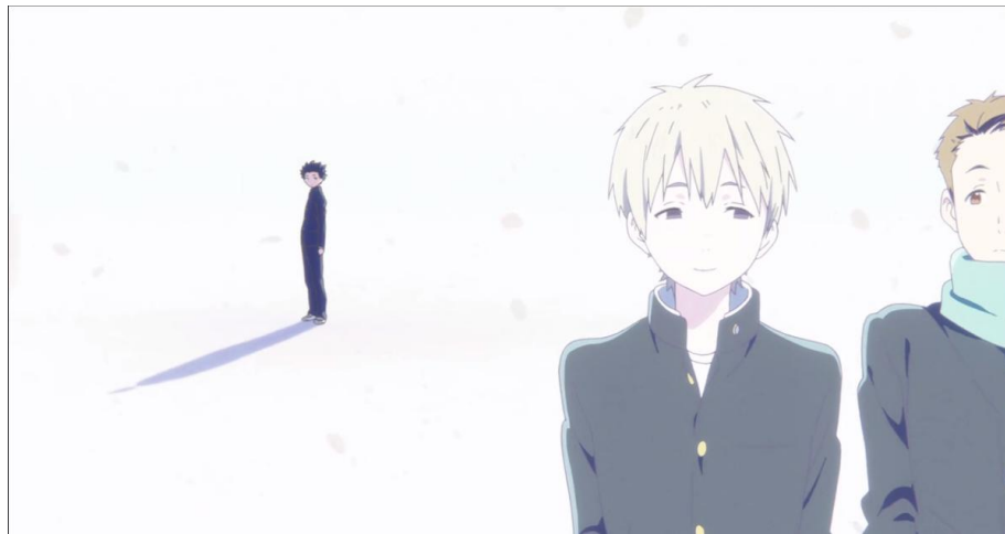
Gambar 3.10. Masa SMP tokoh Ishida Shouya (29:18-29:48)

Masa SMP dalam anime Koe no Katachi merupakan masa yang paling sedikit diperlihatkan, bahkan masa ini hanya digunakan untuk kilas balik kenapa tokoh Ishida Shouya menjadi penyendiri di masa SMA. Berikut adalah adegan tentang hal tersebut.