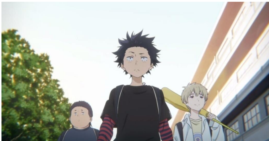
Gambar 3.23. Tokoh Ishida Shouya bersama dengan kedua temannya (15:27)

Tokoh Ishida Shouya dalam anime Koe no Katachi memiliki salah satu sifat sebagai seorang pemimpin meskipun dia masih duduk di bangku sekolah dasar. Pada saat berada di sekolah, dia selalu diikuti oleh dua murid yang salah satunya memiliki tinggi yang sama dengannya dan seorang berbadan gemuk seperti pada gambar berikut ini.