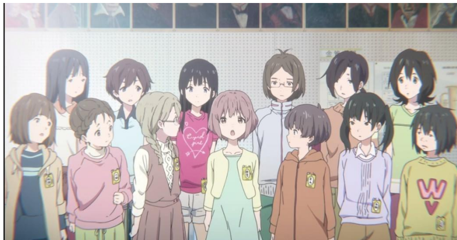
Gambar 3.27. Bentuk fisik Nishimiya Shouko di masa SD (07:09)

Pada masa SD, tokoh Nishimiya Shouko digambarkan memiliki bentuk fisik yang tidak gemuk dan tidak terlalu tinggi untuk anak seusianya. Lalu memiliki model rambut bob pendek dengan warna rambut coklat tua dengan sedikit warna pink. Bentuk fisiknya dapat dilihat pada gambar berikut ini.