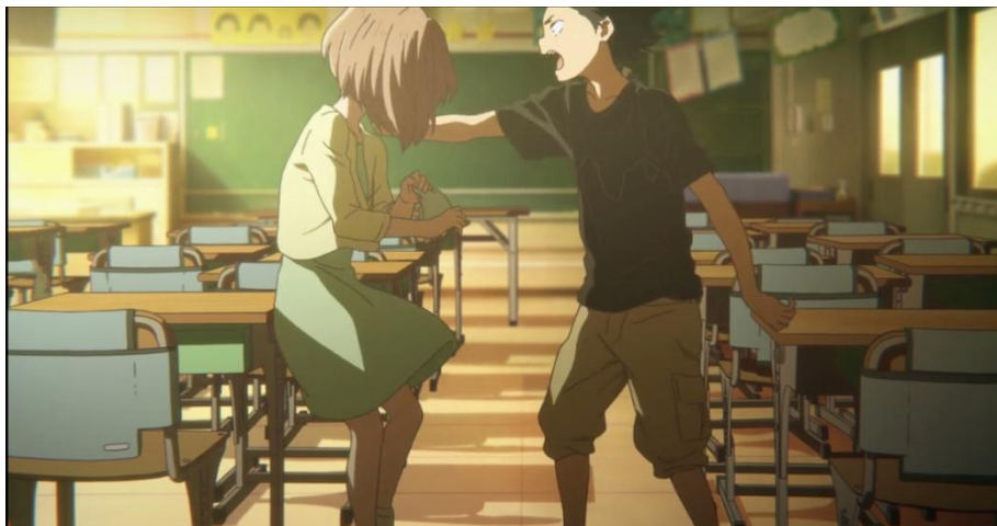
Gambar 3.46. Shouya marah karena Shouko berada didekat mejanya (20:45-22:07)

Gambar-gambar di atas menjelaskan tentang nilai tokoh Ishida Shouya tidak mencerminkan akan nilai kebaikan. Pada Gambar 3.45 dapat dilihat bahwa tokoh Nishimiya Shouko menuliskan kata gomennasai ごめんなさい yang memiliki arti dia meminta maaf kepada Shouya. Meskipun seharusnya Shouya