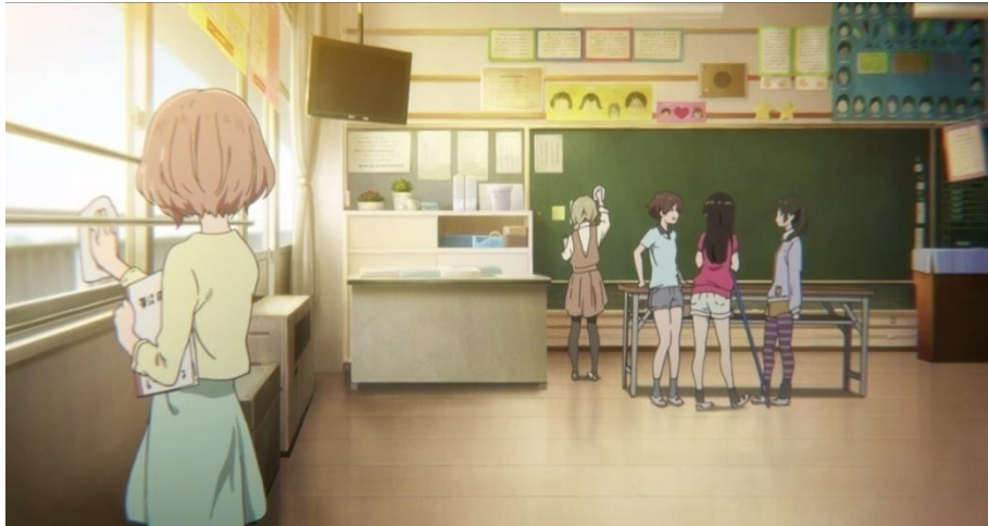
Gambar 3.42. Kebutuhan akan penghargaan tokoh Ishida Shouya (08:28-09:20)