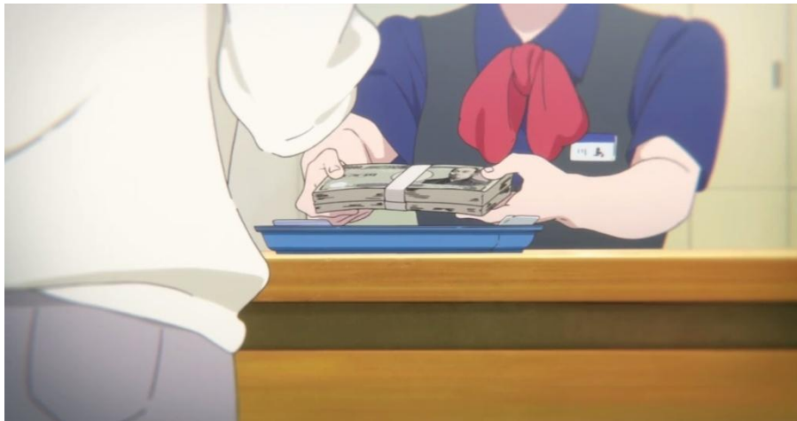
Gambar 3.22. Ibu Ishida mengambil uang di bank (19:07-19:15)

Pada Gambar 3.21 diceritakan tentang keadaan rumah Ishida ketika Ishida pulang ke rumah dan disapa oleh ibunya yang sedang berkerja menata rambut. Sedangkan pada Gambar 3.22 menjelaskan tentang ibunya Shouya yang mengambil uang untuk mengganti rugi alat pendengaran Shouko yang telah dibuang maupun dirusak oleh Shouya di sekolah.