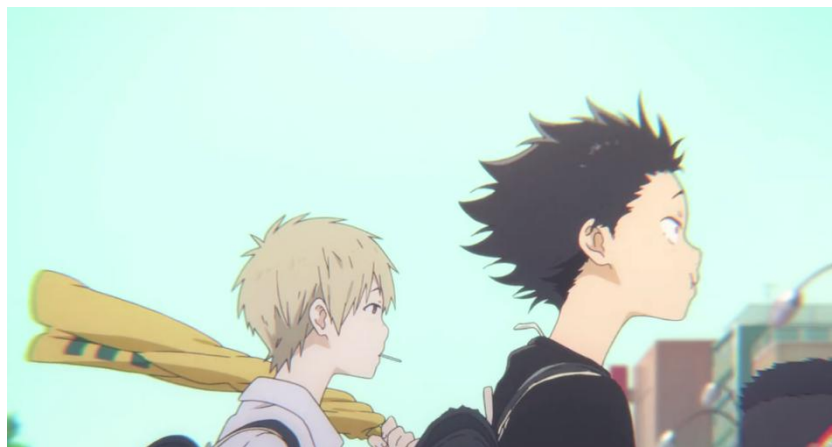
Gambar 3.13. Kemunculan Shouya di awal cerita (00:58-03:56)

Tokoh Ishida Shouya merupakan tokoh utama dalam anime Koe no Katachi . Hal tersebut karena intensitas kemunculan tokoh Ishida Shouya selalu dimunculkan mulai dari awal hingga akhir cerita. Selain itu, Shouya menjadi tokoh yang paling sering mengalami konflik dengan tokoh lain. Perhatikan gambar-gambar berikut ini.