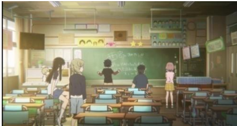
Gambar 3.3. Shouya melakukan ijime pada tokoh Shouko (12:00-14:32)

Nishimiya Shouko. Pertemuan ini terjadi ketika gurunya memberitahu kelasnya akan kedatangan murid baru seperti pada gambar 3.1. Sedangkan pada gambar 3.2, tokoh Nishimiya Shouko memperkenalkan dirinya melalui buku dan menjelaskan pada teman-teman barunya bahwa dirinya tidak dapat mendengar atau penyandang disabilitas fisik.