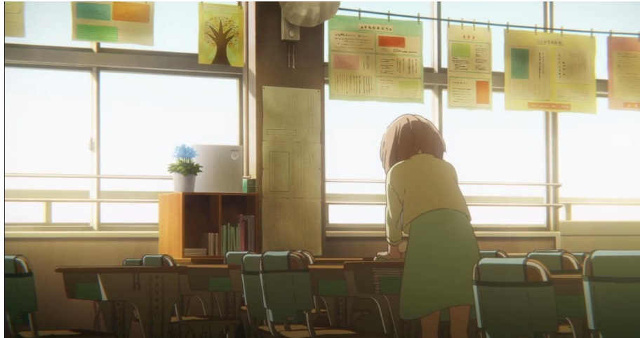
Gambar 3.25. Nilai kebaikan tokoh Nishimiya Shouko saat SD (20:49-21:14)