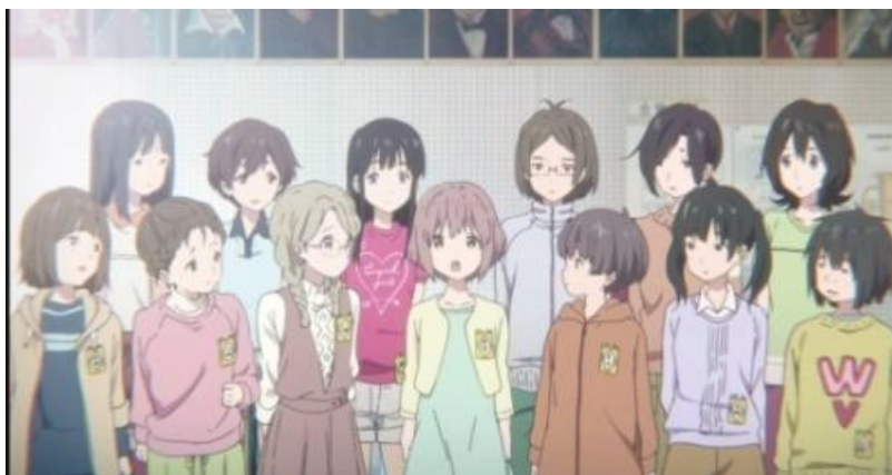
Gambar 3.7. Latihan paduan suara murid kelas 6-2 (06:56-07:35)