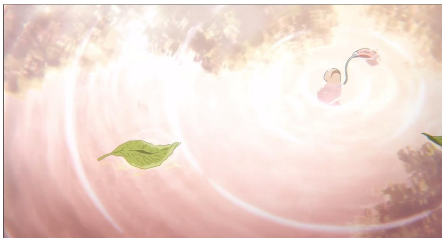
Gambar 3.29. Alat-alat pendengaran yang dibuang oleh Shouya (14:00-14:20)