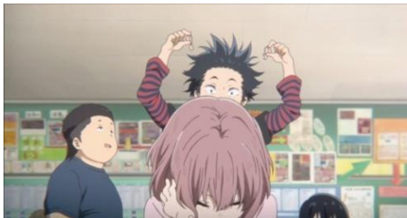
Gambar 3.4. Shouya melakukan ijime pada tokoh Shouko (12:00-14:32)

Potongan pada gambar 3.3, tokoh Ishida Shouya mulai melakukan ijime pada tokoh Nishimiya Shouko dengan cara menulis sebuah ejekan untuk menyerang mentalnya, namun tidak berhasil. Lalu pada gambar 3.4, menjelaskan tentang Shouya yang mengambil alat bantu