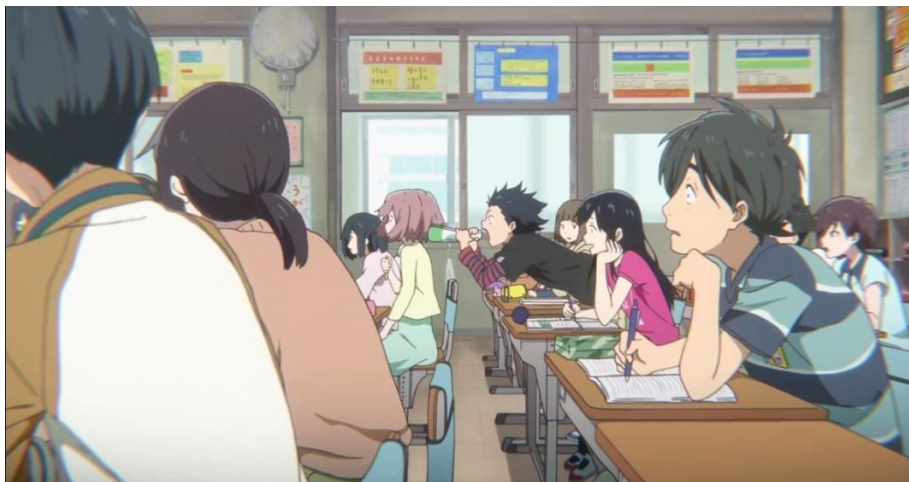
Gambar 3.35. Tokoh Ishida Shouya menjahili tokoh Nishimiya Shouko (11:58-14:33)

d. Perbedaan antara anak normal dan anak penyandang disabilitas membuat sebuah konflik di mana tokoh Ishida Shouya tertarik untuk menjahili tokoh Nishimiya Shouko yang lama-kelamaan menjadi ijime . Hal ini dapat dibuktikan melalui gambar-gambar berikut ini.