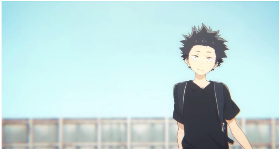
Gambar 3.20. Bentuk fisik tokoh Ishida Shouya di masa SD (2:10)

terlalu tinggi untuk anak seusianya. Serta memiliki model rambut tegak ke atas berwarna hitam. Bentuk fisiknya dapat dilihat pada gambar berikut ini.