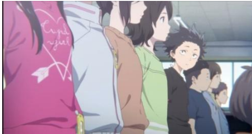
Gambar 3.8. Latihan paduan suara murid kelas 6-2 (06:56-07:35)

Adegan di atas menceritakan tentang para murid kelas 6-2 sedang latihan paduan suara menjelang kompetisi. Gambar 3.7 menggambarkan tentang tokoh Shouko yang bernyanyi lebih cepat dan merusak jalannya latihan. Sedangkan gambar 3.8 menunjukkan tokoh Shouya yang mendengarkan temannya yang mengeluh karena kelas mereka tidak mungkin menang dengan adanya Shouko.