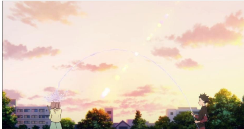
Gambar 3.18. Macam-macam ijime yang dilakukan tokoh Ishida Shouya (11:58-14:33)

Gambar-gambar di atas merupakan beberapa macam bentuk ijime yang dilakukan oleh tokoh Ishida Shouya. Pada gambar 3.16, tokoh Ishida Shouya berteriak sekeras mungkin ke telinga Shouko untuk mengagetkannya. Sedangkan pada gambar 3.17 menjelaskan tentang Shouya yang membuang alat bantu pendengaran Shouko keluar kelas. Lalu bentuk ijime berikutnya adalah Shouya yang menyiramkan air ke Shouko yang terjadi pada gambar 3.18.