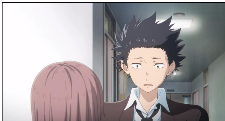
Gambar 3.31. Shouya meminta berteman dengan Shouko (14:43-14:20)