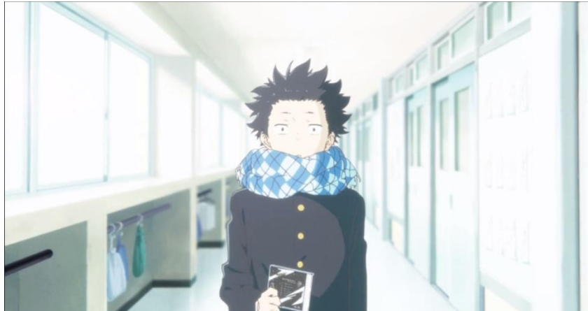
Gambar 3.14. Kemunculan Shouya di tengah cerita (31:28-31:53)