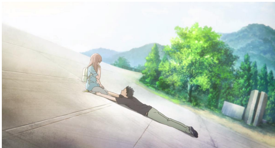
Gambar 3.26. Nilai kebaikan tokoh Nishimiya Shouko saat SMA (1:31:28-1:31:59)

Gambar-gambar di atas menunjukkan nilai kebaikan tokoh Nishimiya Shouko yang menunjukkan bahwa dia adalah tokoh protagonis. Pada Gambar 3.25, tokoh Nishimiya Shouko mengelap meja milik tokoh Ishida Shouya yang dicoret-coret oleh orang tak dikenal. Sedangkan pada Gambar 3.26, Shouko meminta maaf pada Shouya karena menurutnya keberadaan dirinya membuat hubungan Shouya dengan teman-temannya renggang.