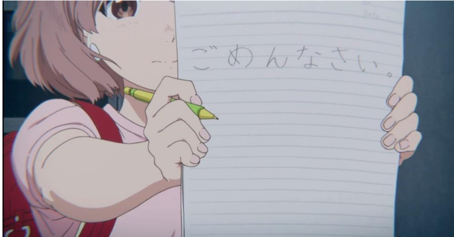
Gambar 3.45. Shouko meminta maaf pada Shouya (14:50-15:18)

yang selalu penuh coret-coretan setelah kasus ijime yang telah dilakukannya terbongkar oleh pihak sekolah. Perhatikan gambar-gambar berikut ini.