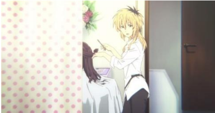
Gambar 3.21. Kediaman keluarga Ishida (2:48-2:57)