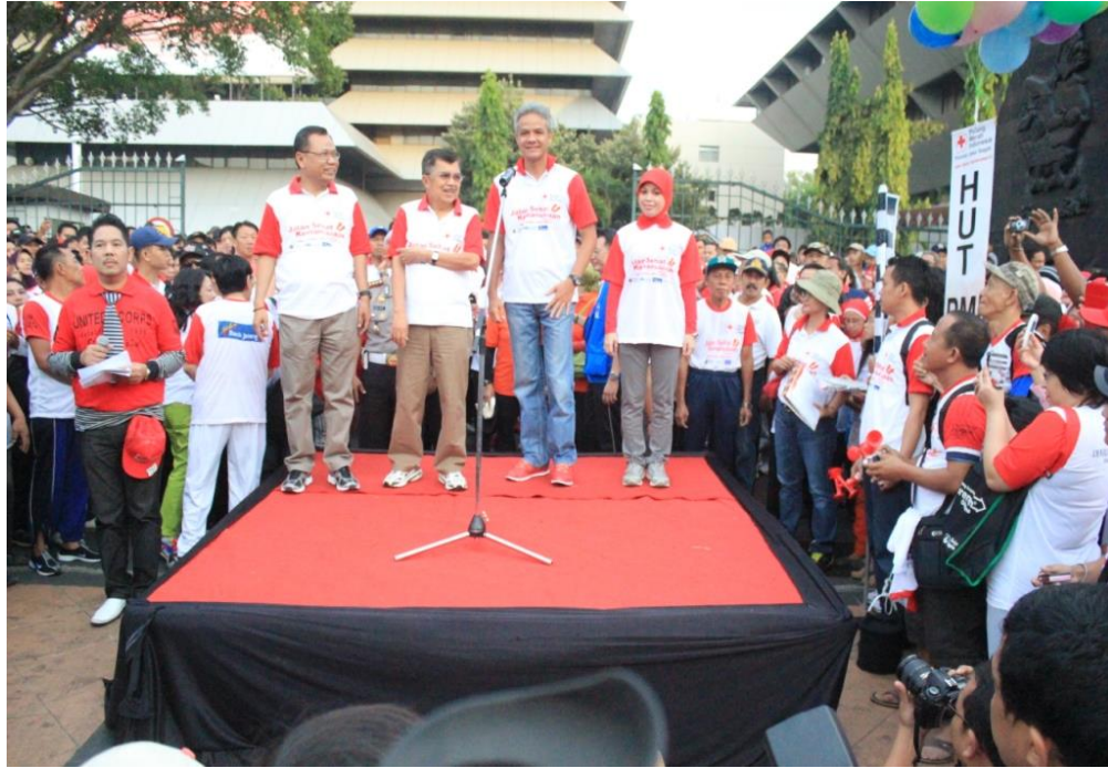
Gambar 2.1.1 DINPORAPAR bersama Bapak Ganjar Pranowo dan Bapak Jusuf Kalla memakai kaos yang diberikan Palang Merah Indonesia Provinsi Jawa Tengah dalam rangka HUT PMI di gubernuran.

Termasuk di dalam Publication ( tools PR/Peran PR ) yang bertujuan agar mitra tetap mengenang atau teringat dengan Palang Merah Indonesia Provinsi Jawa Tengah sebagai mitra PMI Provinsi Jawa Tengah. Harapannya agar mendapatkan loyalitas dari mitra.