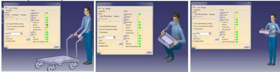
Gambar 4 Saran perbaikan postur dalam mengoperasikan dolly (a), mengangkat atau menurunkan beban (b) dan membawa beban (c)

Saat membawa beban, tubuh sebaiknya tidak membungkuk dan menempelkan beban ke tubuh (lihat Gambar 4c). Hal ini dilakukan agar jarak beban semakin pendek, dan mencegah momen gaya yang besar yang bisa mengakibatkan cedera pada punggung. Posisi kerja membungkuk sebesar 10^\circ dari sumbu bertikal akan menaikkan gaya aksial di pinggal sebesar 65% sedangkan sudut sebesar 30^\circ dapat meningkatkan gaya aksial sampai 120% (Chaffin dan Ashton-Miller, 1991). Hasil perhitungan untuk perbaikan postur membawa beban dapat dilihat pada Tabel 6.