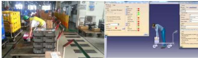
Gambar 2. Postur operator saat mengangkat beban berdasarkan (a) hasil pengamatan (b) rekayasa CATIA.

Gambar 2 menunjukkan hasil dokumentasi dan rekayasa CATIA dari pengamatan sikap kerja operator saat mengangkat beban.