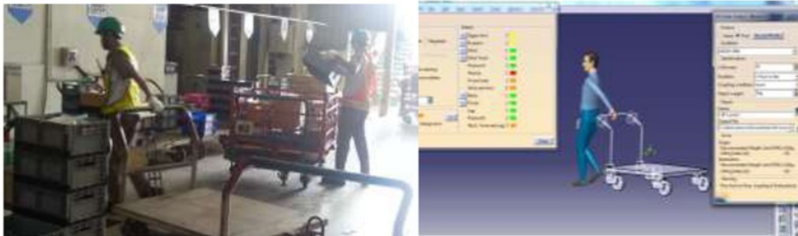
Gambar 1. Postur operator saat menarik dolly berdasarkan (a) hasil pengamatan (b) rekayasa CATIA.

Gambar 1 menunjukkan hasil dokumentasi dan rekayasa CATIA dari pengamatan sikap kerja operator saat menarik dolly .