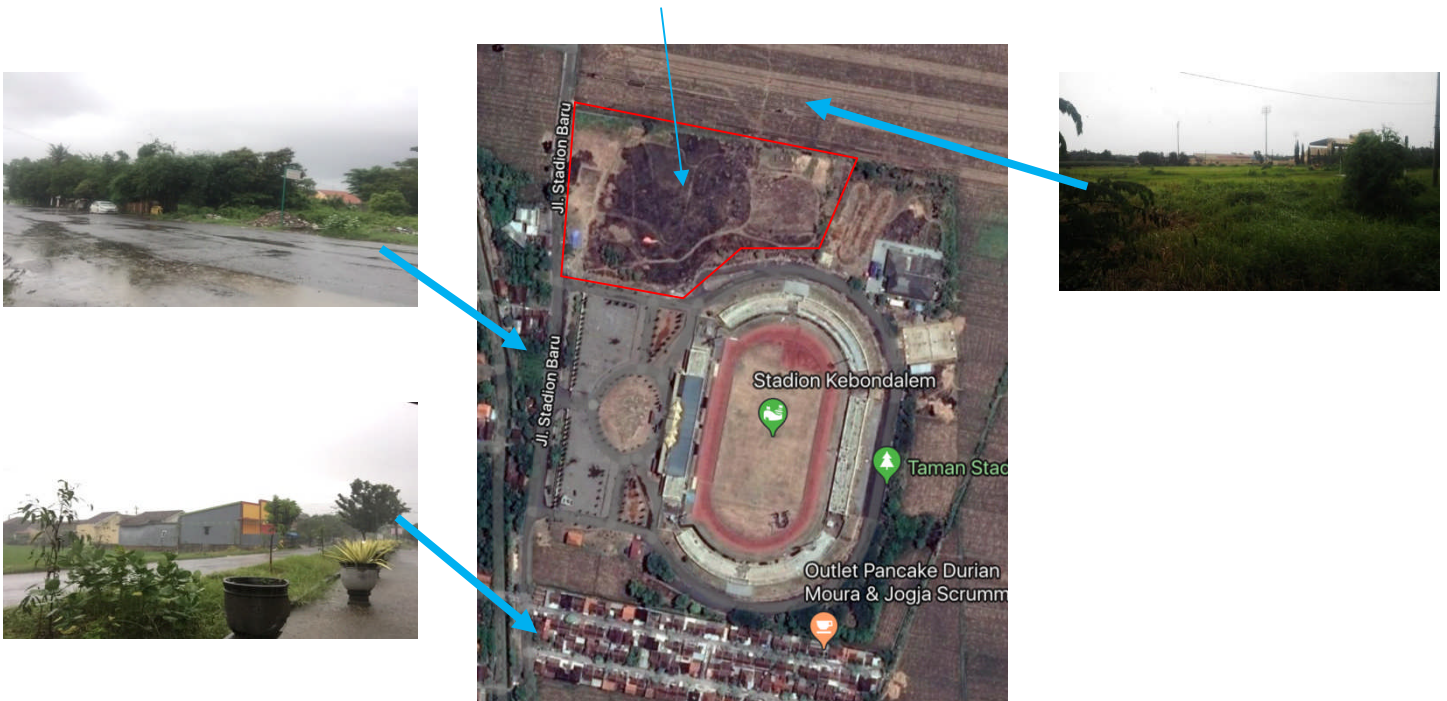
Gambar 3.1 Komplek Stadion Utama kendal

Batas Tapak yang akan dibangun Gedung Olahraga dan Sasana Beladiri