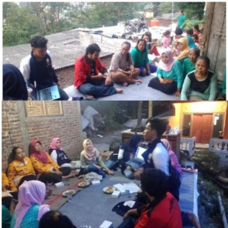
Gambar 5. Teras dan tempat jemur sebagai tempat berkumpul (ruang komunal)