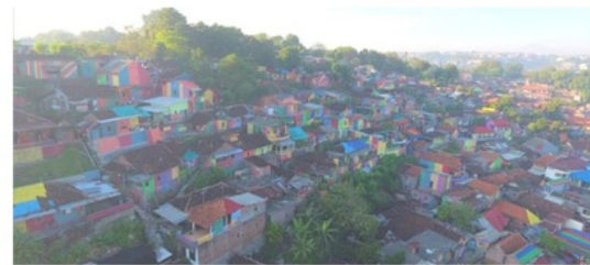
Gambar 3. Bentuk lansekap permukiman Kalisari Semarang

Kota Semarang terkenal akan lansekapnya yang memiliki ciri khas khusus yaitu terdiri dari wilayah pantai, dataran rendah, dataran tinggi dan pegunungan. Ini menjadi sesuatu nilai plus di kota ini. Karena kondisinya yang, maka terdapat wilayah-wilayah yang berada di bukit-bukit. Perkembangan permukiman di kota Semarang maju sangat pesat, baik itu di kawasan pantai hingga di kawasan pegunungan. Perkembangan permukiman juga merambah pada lokasi-lokasi yang berbukit, salah satu permukiman kuno yang berada di bukit dengan lansekap menarik adalah kawasan Kalisari Semarang.