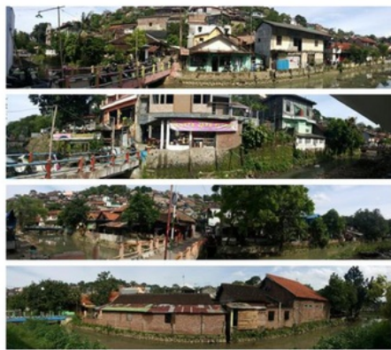
Gambar 2. Kondisi eksisting (Kalisari Semarang)

1992 tentang Perumahan dan Pemukiman, pemukiman atau permukiman adalah bagian dari lingkungan hidup di luar kawasan lindung, baik