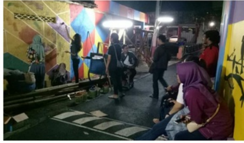
Gambar 4. Jalan digunakan sebagai area berkumpul (ruang komunal)