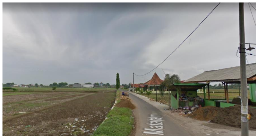
Gambar 6 4 Situasi Tapak Terpilih Sumber : maps.google.com,2018