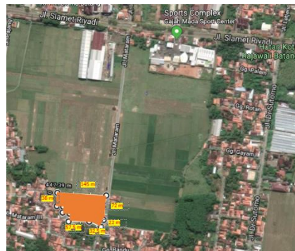
Gambar 6 1 Lokasi Tapak Terpilih