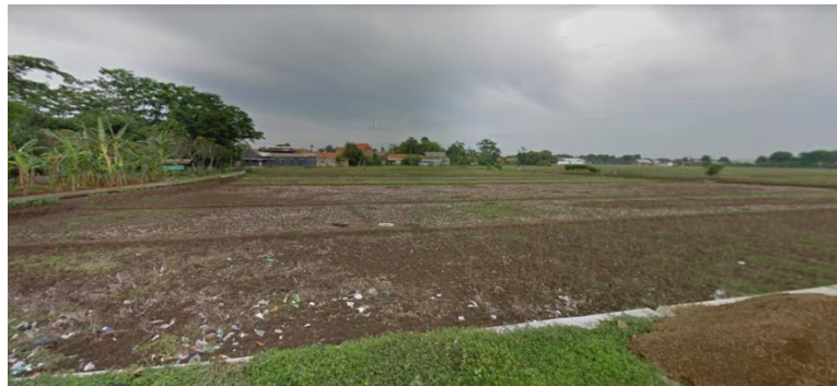
Gambar 6 3 Kondisi Tapak Terpilih