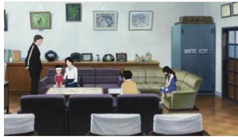
( Ookami Kodomo no Ame to Yuki , 2012. 01:11:02)

Dengan adanya peristiwa tersebut, digambarkan bahwa Souhei menjadi semakin bersalah pada Yuki, bahkan Souhei menjadi sangat berempati pada Yuki. Omoiyari yang berasal dari rasa bersalah Souhei ditunjukkan saat Souhei pulang sekolah. Souhei selalu menyempatkan diri ke rumah Yuki, membawakan dia roti, buah dan pekerjaan rumah yang harus Yuki kerjakan selama tidak masuk sekolah. Dapat dibuktikan pada kutipan berikut :