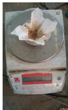
Menimbang cawan + kertas saring + residu