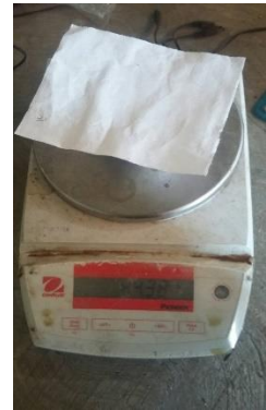
Menimbang cawan + kertas saring