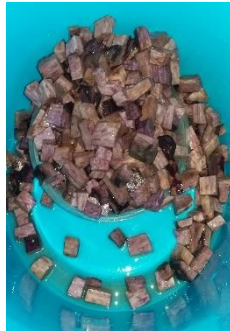
Potongan Uwi Ungu