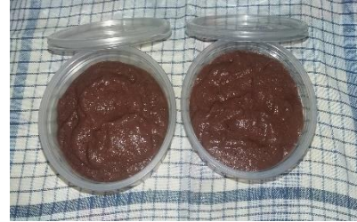
Uwi yang sudah dihaluskan