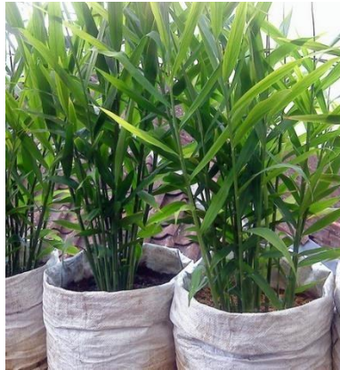
Gambar 1. Tanaman Jahe

Jahe putih/kuning besar atau disebut juga jahe gajah atau jahe badak memiliki rimpang yang lebih besar dan gemuk dengan ruas rimpangnya lebih menggembung dari kedua varietas lainnya. Bagian dalam rimpang apabila diiris/dipotong/dipatahkan akan terlihat berwarna kekuningan. Tinggi rimpang dapat mencapai 6-12 cm, dengan panjang antara 15-35 cm, dan diameter berkisar 8.47-8.50 cm. Jenis jahe ini biasa dikonsumsi baik saat berumur muda maupun berumur tua, baik sebagai jahe segar maupun jahe olahan (Syukur, 2002; Hamiudin, 2007).