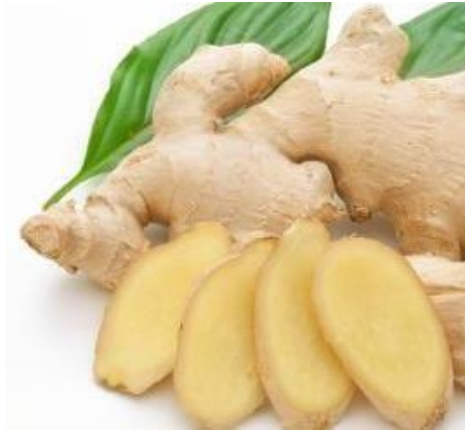
Gambar 2. Rimpang jahe

Jahe dapat dibuat berbagai produk olahan jahe seperti simplisia, oleoresin, minyak atsiri, dan serbuk jahe. Jahe memiliki sifat khas, yaitu oleoresin dan minyak atsiri. Minyak atsiri dan oleoresin jahe terdapat pada sel-sel minyak jaringan korteks dekat permukaan kulit (Koswara, 1995).