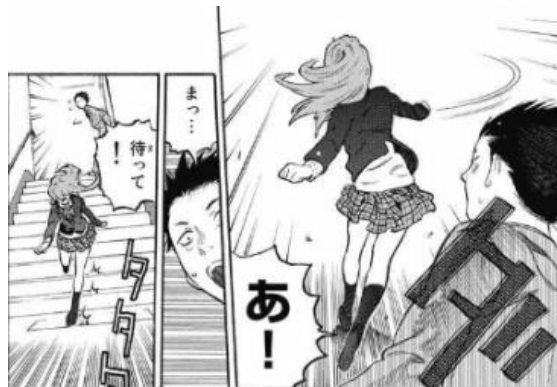
Gambar 4. Ishida mengejar Shouko

Setelah proses ekranisasi bagian alur pada tahap permunculan konflik dalam anime mengalami perubahan variasi. Dalam komik pada bagian awal cerita diperlihatkan adegan Ishida yang bertemu Shouko setelah enam tahun berlalu. Setelah itu, Shouko yang terkejut pun pergi berlari menjauhi Ishida. Ishida pun mencoba mengejar Shouko dengan tujuan ingin meminta maaf atas perbuatannya dan mencoba memperbaiki hubungan dengan Shouko.