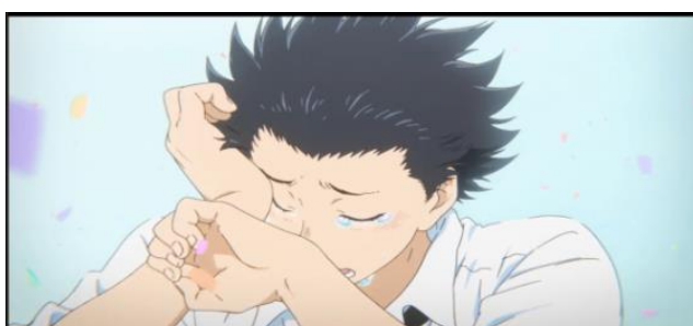
Gambar 3. Ishida menangis (02:04:50 - 02:05:33)

Penambahan latar suasana dalam anime digambarkan pada saat Ishida menangis tersedu-sedu karena ia terharu sekaligus bahagia bisa kembali berkumpul dengan teman-temannya. Hal tersebut juga membuat hati Ishida lebih terbuka dengan orang-orang disekitarnya.