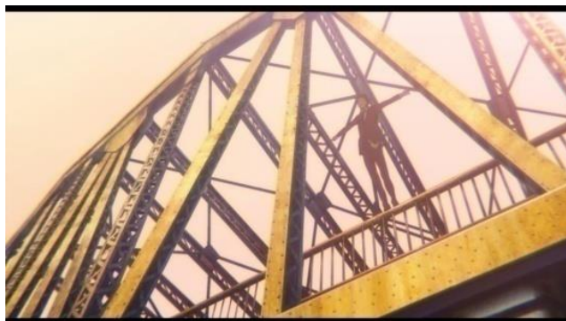
Gambar 5. Ishida Mencoba Bunuh Diri 0:01:02 – 0:02:00