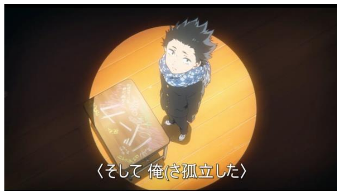
Gambar 2. Ishida yang merasa kesepian (00.29.31 – 00.29.48)

Penambahan latar suasana pertama terjadi pada adegan singkat penggambaran Ishida mengenai dirinya yang dijauhi oleh teman-teman dan sahabatnya setelah kejadian saat di sekolah dasar enam tahun yang lalu. Hal tersebut membuatnya merasa kesepian.