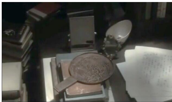
Gambar 4 Cermin perunggu yang ada di TKP (menit 17:42)

Dalam cerpen pada kutipan poin 3.2.3.1 no.2 Kare memiliki cermin perunggu, namun cermin tersebut hanya disebutkan satu kali di awal. Sedangkan dalam film cermin perunggu ada di sepanjang cerita sebab dijadikan alat pembunuhan.