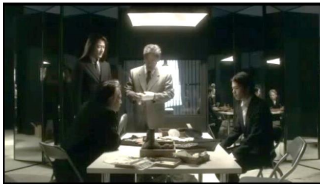
Gambar 19 Diskusi perkembangan penyelidikan (menit 34:42- 36:42)

Mendiskusikan hasil pemeriksaan cermin, penyebab menjadinya senjata mematikan.