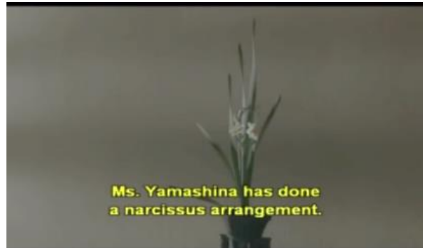
Gambar 6 Bunga Dafodil di sekolah upacara minum teh (menit 4:06)

Sedangkan latar waktu dalam film berlangsung selama musim semi. Ditunjukkan dengan adanya bunga dafodil atau narcissus , jenis bunga yang tumbuh pada musim semi. Selain itu kejadian terbunuhnya beberapa wanita secara misterius hingga tertangkapnya pelaku, terjadi hanya selama beberapa hari.