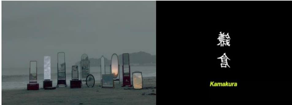
Gambar 12 Pantai di Kamakura (menit 00:34 - 00:44)