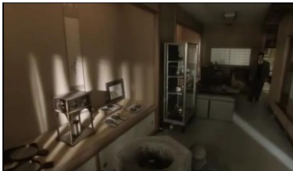
Gambar 3 Toko Barang Antik Kawazen (menit 09:58)

Selain lokasi rumah, di dalam film rumah Kare berubah menjadi rumah toko yang menjual barang-barang antik bernama Kawazen. Salah satu barang yang dijual adalah cermin perunggu, yang merupakan bagian dari benda latar.