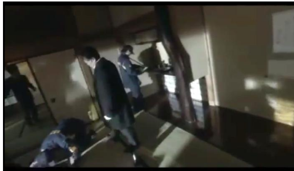
Gambar 14 petugas polisi sedang memeriksa TKP (menit 6:45 - 7:00)

kepada detektif kepolisian. Kemudian mereka bersama-sama meminta keterangan dari asisten Sayoko.