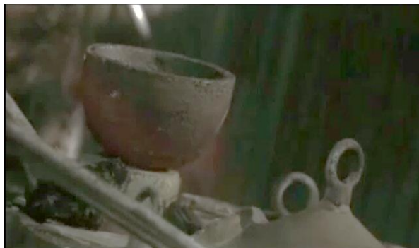
Gambar 5 Studio kerja Toru (menit 11:08)

Pada film tokoh Toru bekerja di workshop atau studio kerja yang ada di toko barang antik milik keluarganya. Studio kerja Toru digunakan untuk membuat cermin perunggu yang akan dijual di toko Kawazen. Perubahan tempat kerja tokoh pada film dilakukan untuk menyesuaikan dengan jalan cerita dan profesi Toru.