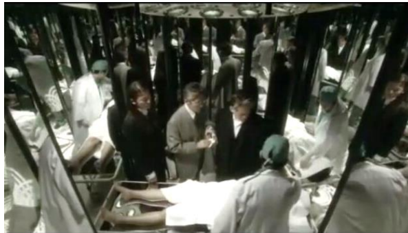
Gambar 15 Petugas forensik memperlihatkan kondisi mayat (menit 7:59 – 8:38)

Adegan dalam film ketika petugas forensik memberi tahu hasil autopsi mayat yang wajahnya hancur tetapi penyebabnya masih belum diketahui.