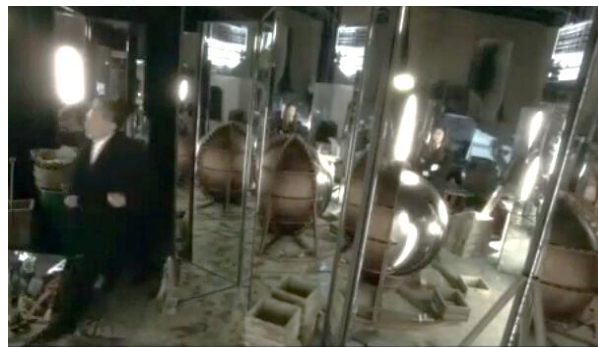
Gambar 10 Polisi, Akechi, dan bola cermin di studio kerja Toru (menit 38:44)

Betapa terkejutnya aku, melihat bagian dalam bola sepertinya terbuat dari kaca yang tebal. Bersamaan dengan suara pukulan dan suara mengerikan, bola cermin pun hancur berkeping-keping.