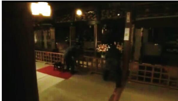
Gambar 17 Memeriksa keadaan patung Budha (menit 15:38 - 16:55)