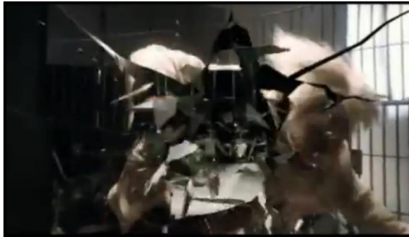
Gambar 11 Toru melompat ke cermin pembatas (menit 45:03)