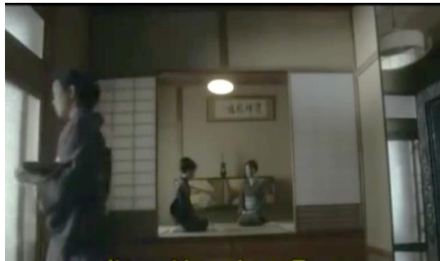
Gambar 7 Dua tokoh sedang berbincang (menit 3:35 – 4:21)

Saat itu ada lima, enam orang yang bercerita tentang cerita menakutkan dan aneh secara bergiliran. Yang terakhir teman K mulai bercerita.