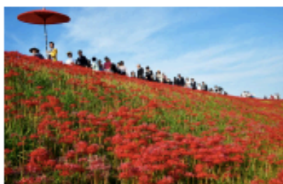
Red spider lilies are in bloom in Handa, Aichi Prefecture, in September 2015.

In the city of Handa in Aichi Prefecture, where author Nankichi Niimi (1913-1943) was born, the banks of the Yakachigawa river are now ablaze with 3 million "higanbana" (red spider lilies).