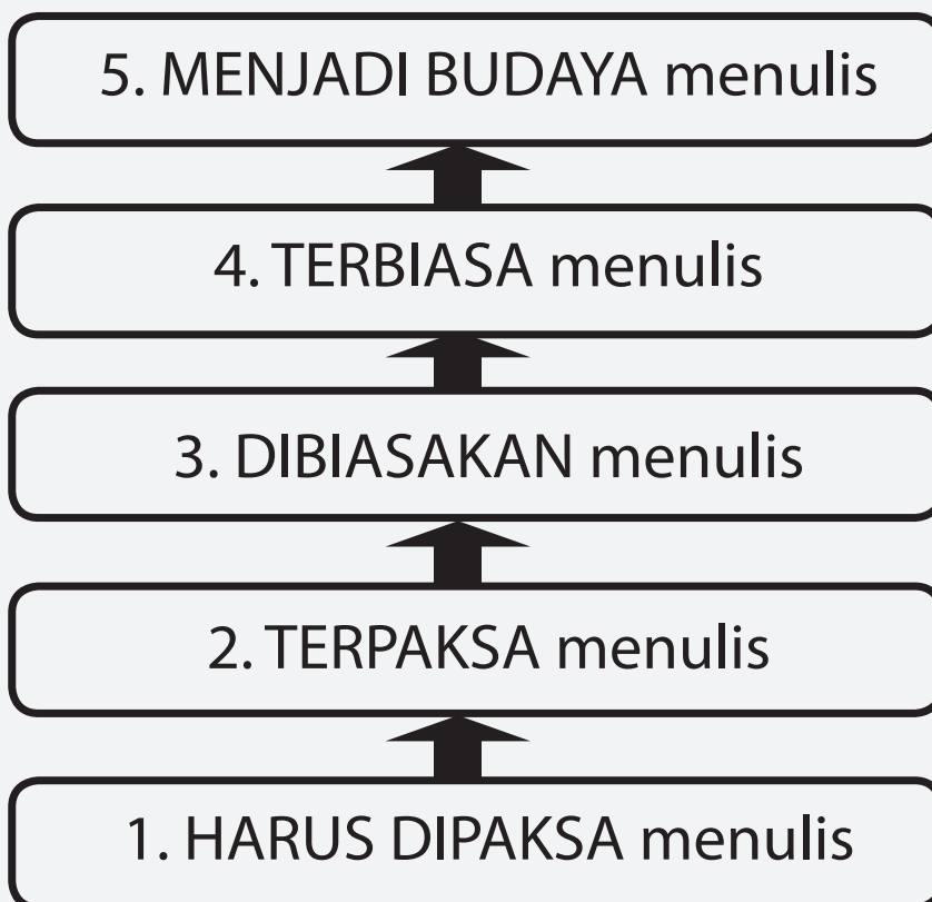
Gambar 2. Proses Pembudayaan Pustakawan dalam Menulis

Lalu pertanyaan yang seringkali kita dengar “Bagaimana memulai menulis?” Memang saat membuat awal kalimat terasa begitu sangat berat. Alat tulis yang sudah kita pegang dan siap digoreskan seolah-olah tidak bisa digerakkan, begitu juga pikiran jadi seperti buntu tanpa satupun ide/gagasan yang keluar. Namun demikian, saya yakin apabila sering diasah/dilatih, saya yakin pasti bisa. Agar pustakawan bisa menulis karya tulis ilmiah, maka pustakawan wajib melakukan 5 (lima) proses pembudayaan untuk menulis, yaitu: