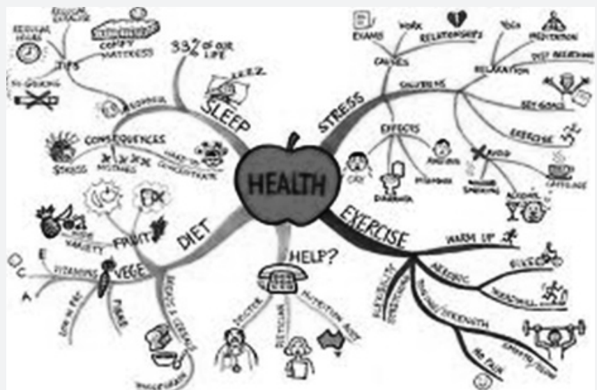
Gambar 3. Contoh Mind Map 'Sehat'

Jika pustakawan akan membuat karya tulis dalam bentuk artikel dengan topik 'Sehat Alami di Usia Senja', maka mind map -nya seperti pada Gambar 3 berikut: