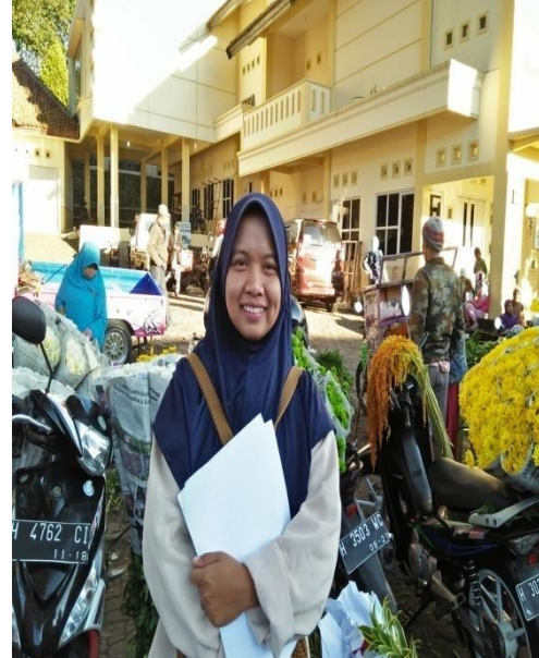
Pasar Bunga Bandung