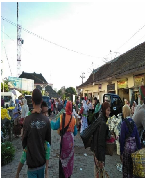
Pasar Bunga Bandung