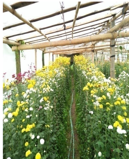
Kebun Bunga Krisan