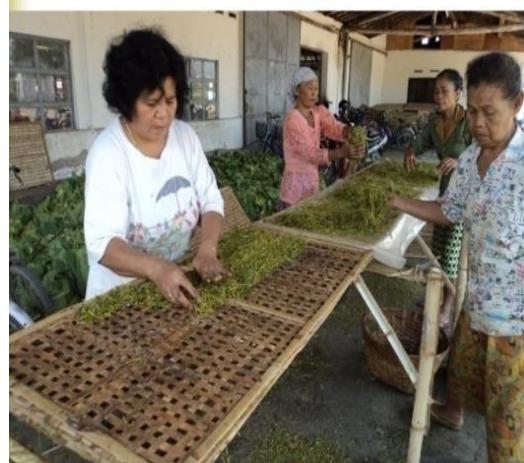
Penataan di para-para