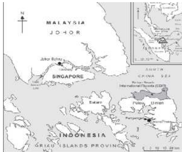
Gambar 1.1 Peta wilayah Sijori : Singapura Johor dan Riau