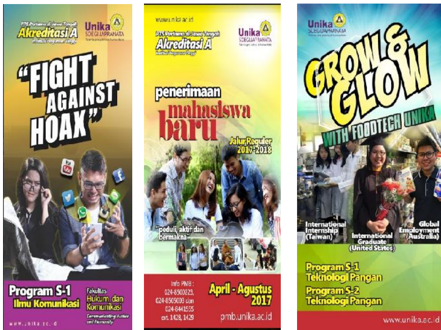
Contoh desain baliho yang terpasang di titik baliho Jl. Diponegoro (tanjakan Siranda)