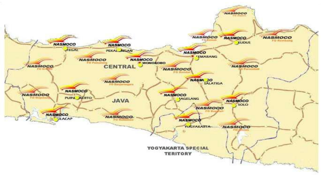
Wilayah Kerja PT New Ratna Motor