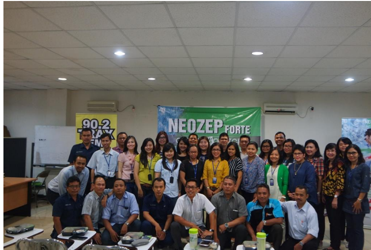
Gambar 10. Salah satu Signature Event Client yang digelar