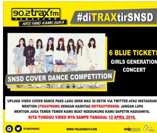
Gambar 16. Salah satu program pembagian tiket gratis

sekali waktu diberikan hal-hal yang bisa menarik. Sekali waktu juga kita mengadakan surprise untuk yang berulang tahun.”