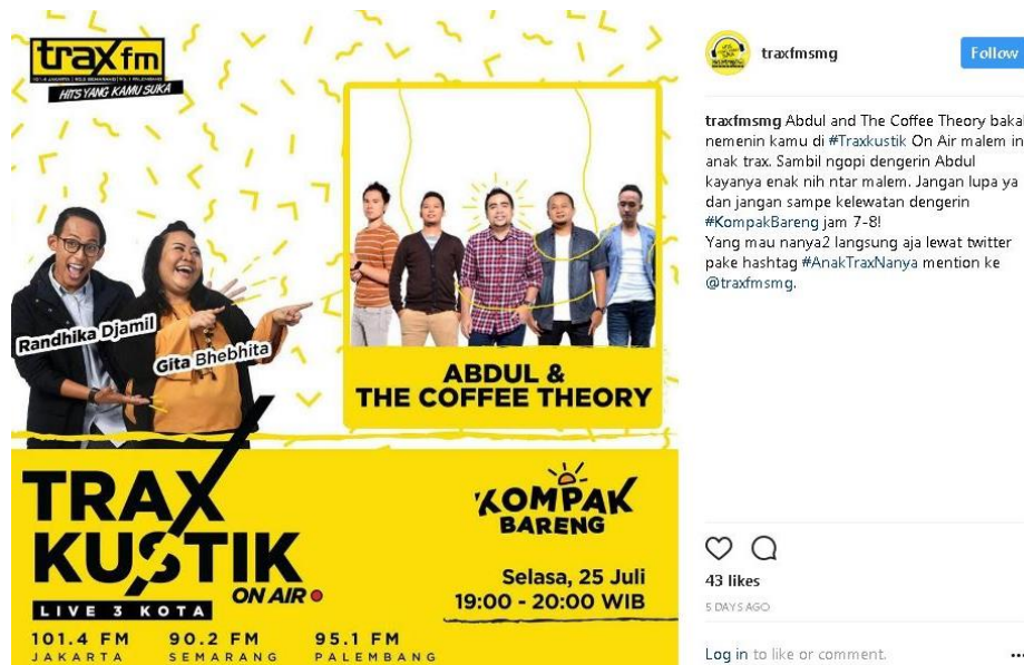
Gambar 15. Contoh desain dan konten instragam di @traxfmsmg

Sedangkan guna menyesuaikan konten yang akan dikirim ke sosial media supaya khalayak dapat dengan mudah menerima pesan tersebut, Trax