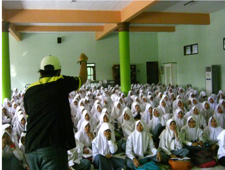
Gambar 11. Event bersama siswa SMA

Sebelum event tersebut digelar, pihak R&D ( Research and Development ) dari Trax FM Semarang akan mengadakan sebuah riset guna mengetahui apa yang dibutuhkan oleh masyarakat, sehingga meminimalisir pengadaan event yang sia-sia. Sedangkan pihak A&P ( Advertising and Promotion ) akan melakukan briefing kepada para troopers yang bertugas guna pembagian tugas ( Job Description ).