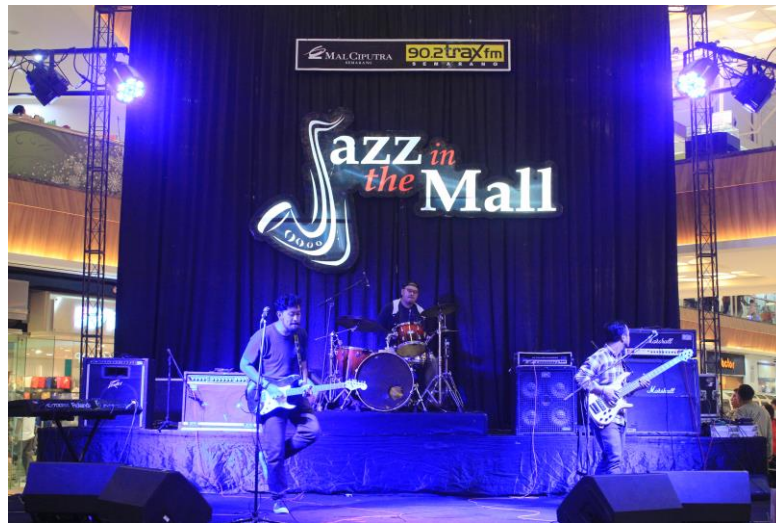
Gambar 12. Jazz in the Mall , salah satu event Trax FM Semarang dengan target market kalangan umum.

Agus Ahmad Muzahid menerangkan "harusnya sih event yang digelar sesuai segmentasi, tetapi tidak selalu. Tapi sebisa mungkin 50% keatas itu adalah target kita. Misalnya ke sekolah, segmentasi kita menengah keatas. Sedangkan dalam satu sekolah kan belum tentu sama."