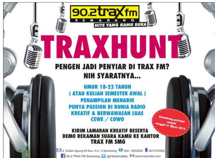
Gambar 9. Contoh Poster Trax Hunt