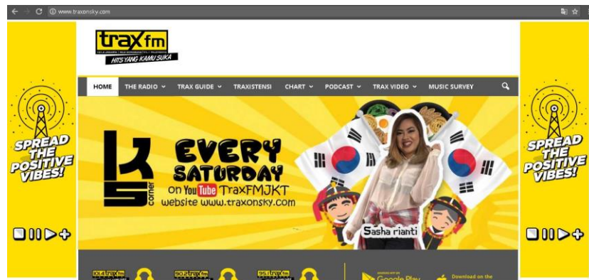
Gambar 13. Tampilan website Trax FM di http://traxonsky.com

“...sebenarnya untuk social media itu kita punya admin sendiri. Tapi untuk beberapa program kita kasih ke penyiar biar mengelola sendiri. Yang paling disorot itu video, kan setiap social media ada durasinya masing-masing. Untuk warna sih kita ada rencana bikin penyeragaman warna, tapi itu masih proses.”