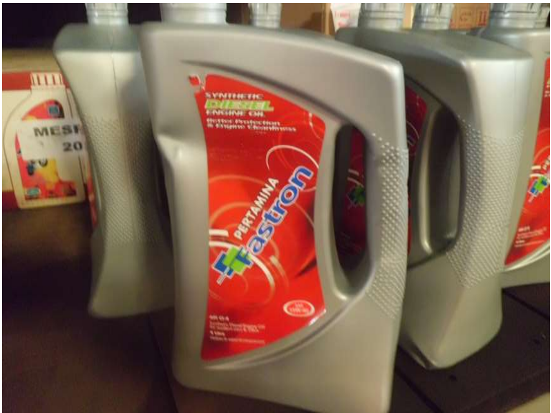
Gambar 1.1 Salah satu produk PT. Pertamina Lubricants, Fastron