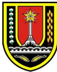
Gambar 2.1 Logo Dinas Kelautan dan Perikanan Kota Semarang.